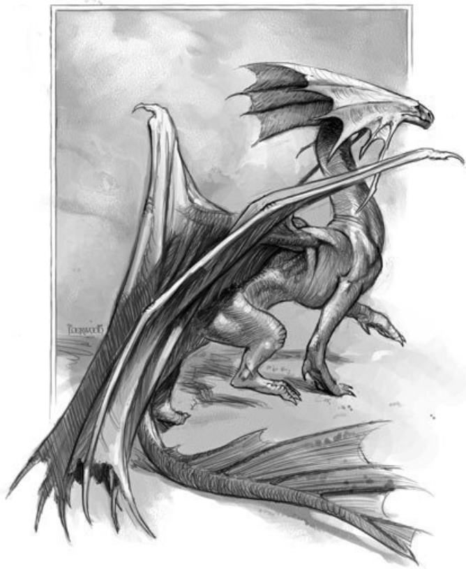
Ахиатский пустынный дракон