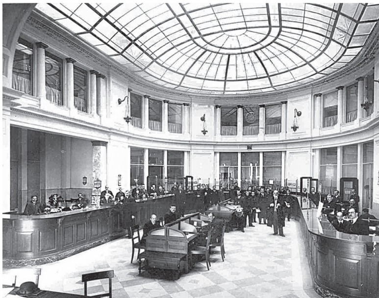
Операционный зал банка. Фото нач. XX в.

Кроме того, выяснилось, что старые стены требуют укрепления. Как мы помним, при первоначальном заключении архитектор указывал обратное и, соответственно, укрепление стен не включил в смету на строительство. Пришлось укреплять старые стены, вставляя в них железобетонные колонны, которые образовали монолитный каркас, способный выдержать надстройку. Все работы на объекте вело петербургское товарищество «Дело», авторский надзор осуществлял архитектор В. П. Цейдлер, скульптурное убранство фасадов ис-