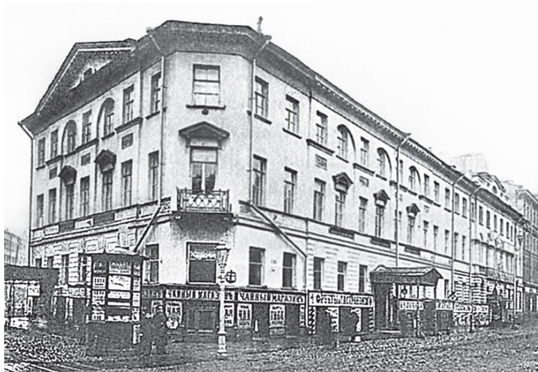
Дом братьев Берниковых. Фото нач. XX в.

пане было устроено полуциркульное окно. Скошенный угол украшал небольшой балкон на уровне второго этажа. Прямоугольные оконные проемы дома второго и третьего этажей частью располагались в полуциркульных нишах и были дополнительно украшены треугольными сандриками. Входы в здание находились как со стороны проспекта, так и с Малой Морской улицы. В начале XX в. оба парадных входа дополняли металлические зонтики.