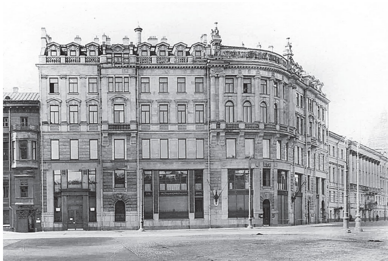
Дом А. И. Глуховского. Фото нач. XX в.

Из торговых предприятий в доме работал «Английский магазин» шотландца Джона Пикерсгиля (Пикерсджилла), который он открыл в 1784 г. Интересно, что подданному английской короны, начавшему бизнес в России, было всего 19 лет. Позднее Пикерсгиль перенес свой магазин в дом № 16 на Невском проспекте и, судя по архивным данным, успешно вел дела еще долгие годы, причем не только в Санкт-Петербурге.