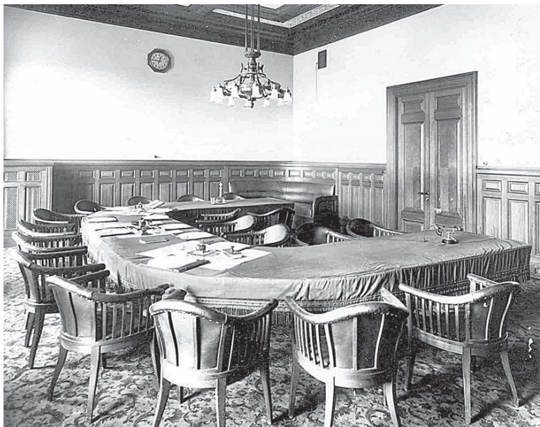
Зал заседаний банка. Фото нач. XX в.

Кассовый зал устроен на первом этаже. На верхние этажи ведут три лестницы. Одна из них – парадная, мраморная. Кабинеты руководства банка, зал заседаний правления и другие парадные помещения зодчий разметил на втором этаже.