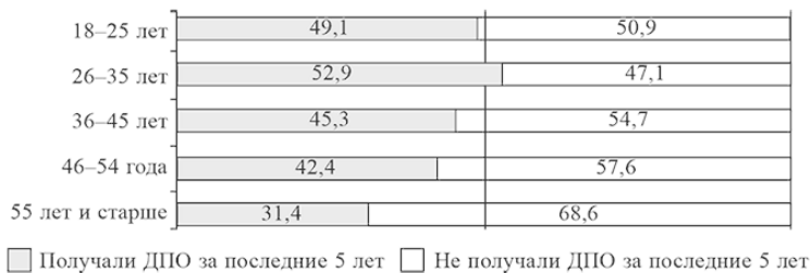
Рис. 1. Доля включенных в систему ДПО россиян различного возраста, 2015 г., % от работающего населения

возрастной когорте меньше трети ее представителей повышали свой профессиональный уровень за предыдущие пять лет.