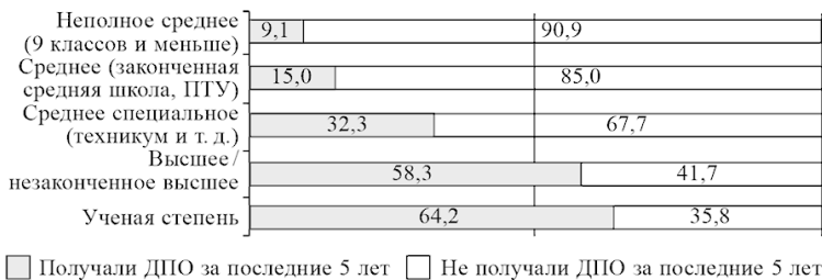
Рис. 2. Доля включенных в систему ДПО среди россиян с различным уровнем образования, 2015 г., % от работающего населения

Надо отметить, что размер и тип поселения в меньшей степени, чем уровень образования, влияют на включенность россиян в систему дополнительного образования. Так, даже в сельских поселениях свыше трети работающего населения за последние пять лет повышали свой профессиональный уровень. В городах, особенно административных центрах субъектов Российской Федерации, включая Москву, данный показатель самый высокий – около 50 % (рис. 3). Тем не менее разрыв между Москвой и селами по доле получавших ДПО не очень велик и составляет всего 14,5 % – это намного меньше, чем разрыв в 55,1 % между полярными по уровню их образования группами. Таким образом, для активности в сфере ДПО сейчас не так важно, где живет человек, как то, каков его исходный образовательный уровень.