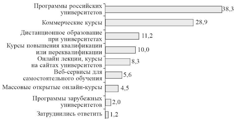
Рис. 5. Формы дополнительного образования, использовавшиеся работающими россиянами, 2015 г., % от работающего населения, получавшего ДПО в предыдущие пять лет

Как правило, в течение пяти лет получавшими дополнительное образование использовалась какая-то одна его форма. Однако попадаются и россияне, использовавшие две и более его форм, и вероятность встретить таковых в разных группах разная. Это хорошо видно при обращении к показателю среднего числа форм ДПО, использовавшихся в течение последних пяти лет в разных группах. Так, в возрастной когорте 26–35 лет этот показатель 1,19 против 1,11 среди тех, кому от 46 до 54 лет; у имеющих высшее или незаконченное высшее образование он 1,18 против 1,07 в группе работников со средним специальным образованием; в Москве он 1,29 против 1,09 в селах; среди руководителей он 1,28