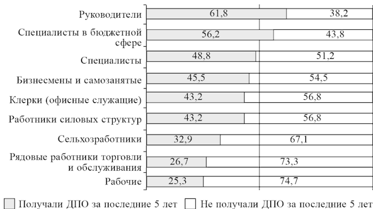
Рис. 4. Доля включенных в систему ДПО среди россиян из разных профессиональных групп, 2015 г., % от работающего населения

Наиболее часто за последние пять лет совершенствовали свое образование руководители и профессионалы (50 % и более), причем специалисты в бюджетной сфере (например, врачи и педагоги) делали это на 7 % чаще, чем остальные специалисты. Такая разница между специалистами бюджетной и небюджетной сфер объясняется тем, что первые в отличие от вторых обязаны периодически подтверждать свою квалификацию и проходить обучение (например, врачи раз в пять лет проходят сертификацию, включающую обучение). Сравнительно реже получали дополнительное образование бизнесмены и самозанятые, хотя и среди них соответству-