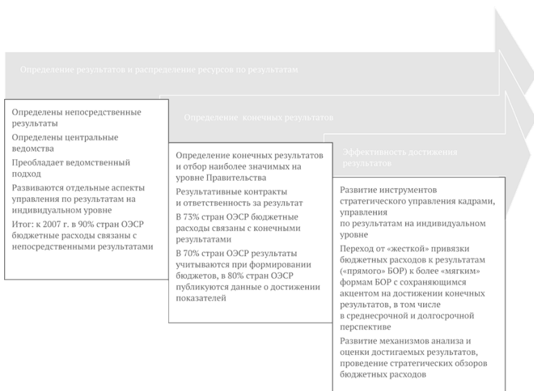
Рис. 1.1. Этапы внедрения управления по результатам в зарубежной практике

(статс-секретарями), внедрение механизмов оплаты труда по результатам, инструменты мониторинга и оценки качества государственных услуг. На данном этапе также проявились такие характеристики, как селективный отбор наиболее значимых показателей эффективности и результативности (например, в Великобритании канцелярия премьер-министра отбирала 30–40 наиболее значимых показателей для постоянного мониторинга среди более 100 целевых национальных показателей).