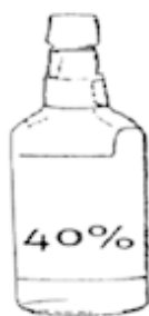
Бренди, джин, виски