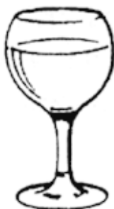
1 бокал столового вина