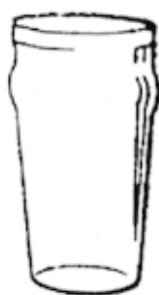
1/2 пинты пива

Некоторые более крепкие сорта пива, вроде специального лагеря, содержат алкоголь до 8 %. Для сравнения нормальных мер спиртных напитков, приводим данную последовательность, все составляющие которой приблизительно эквивалентны по крепости, то есть по количеству содержания абсолютного алкоголя. Все они равны 1 единице алкоголя (10 ml или 8 г спирта приблизительно):