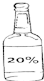
Крепленое вино (херес, порт и т.д.)