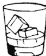
1 шот виски