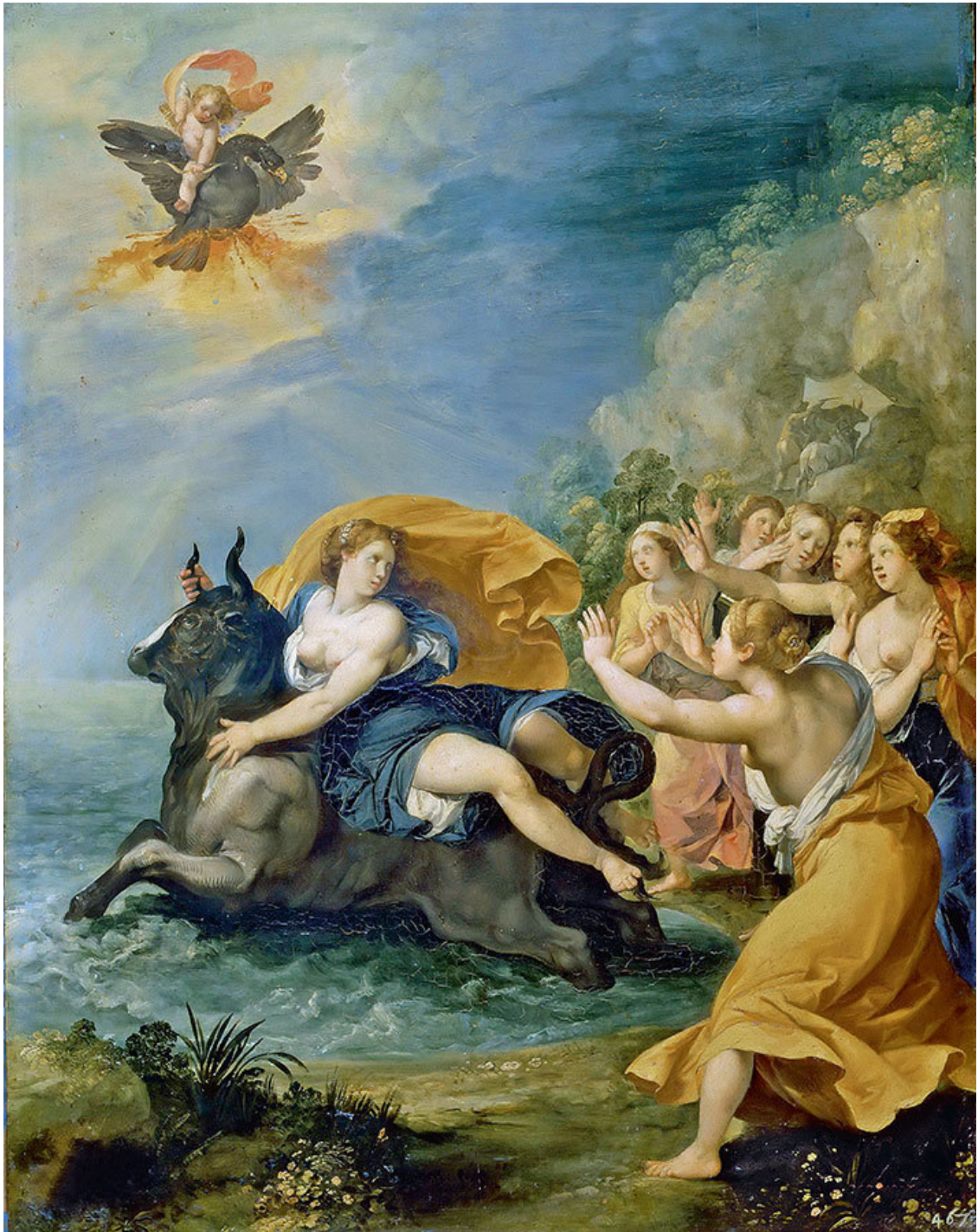
Джузеппе Чезари. Похищение Европы. 1603–1606 гг.

– На уединенной поляне увидишь ты корову, которая никогда не знала ярма. Следуй за ней, и там, где ляжет она на траву, воздвигни стены города, а страну назови Беотия.