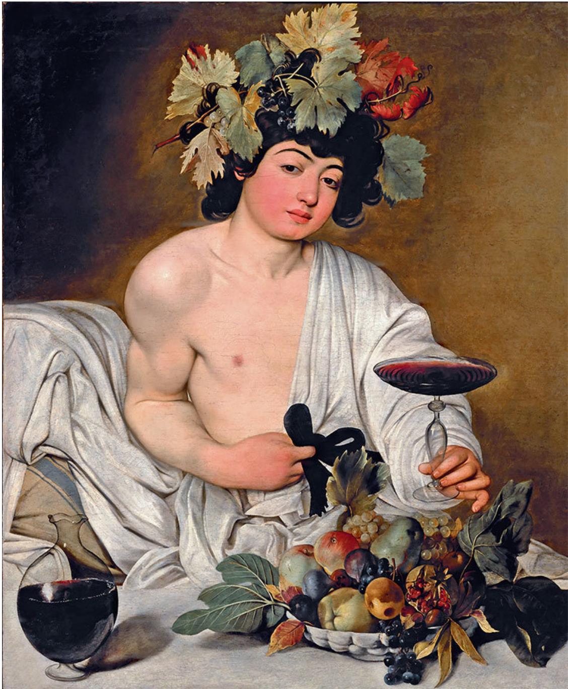
Караваджо. Вакх. Ок. 1596 г.

– Презренный! Смотри, ветер попутный! Быстро понесется корабль наш по волнам безбрежного моря. О юноше же мы позаботимся потом. Мы приплывем в Египет, или на Кипр, или в далекую страну гипербореев и там продадим его; пусть-ка там поищет этот юноша своих друзей и братьев. Нет, нам послали его боги!