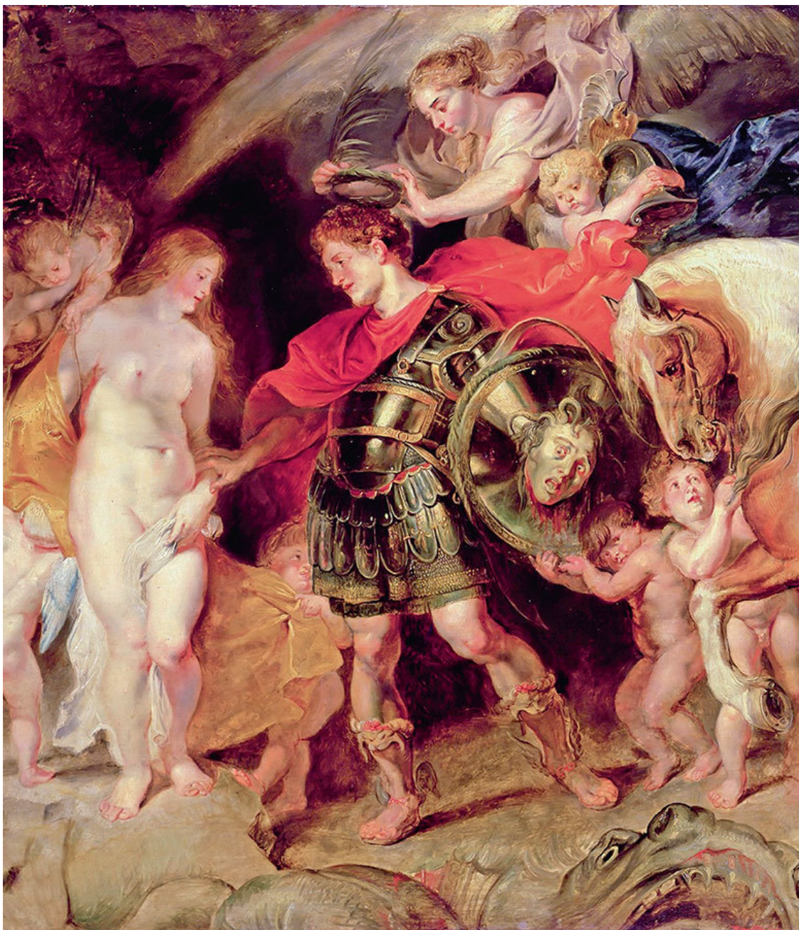
Питер Пауль Рубенс. Персей освобождает Андромеду. Ок. 1620 г.