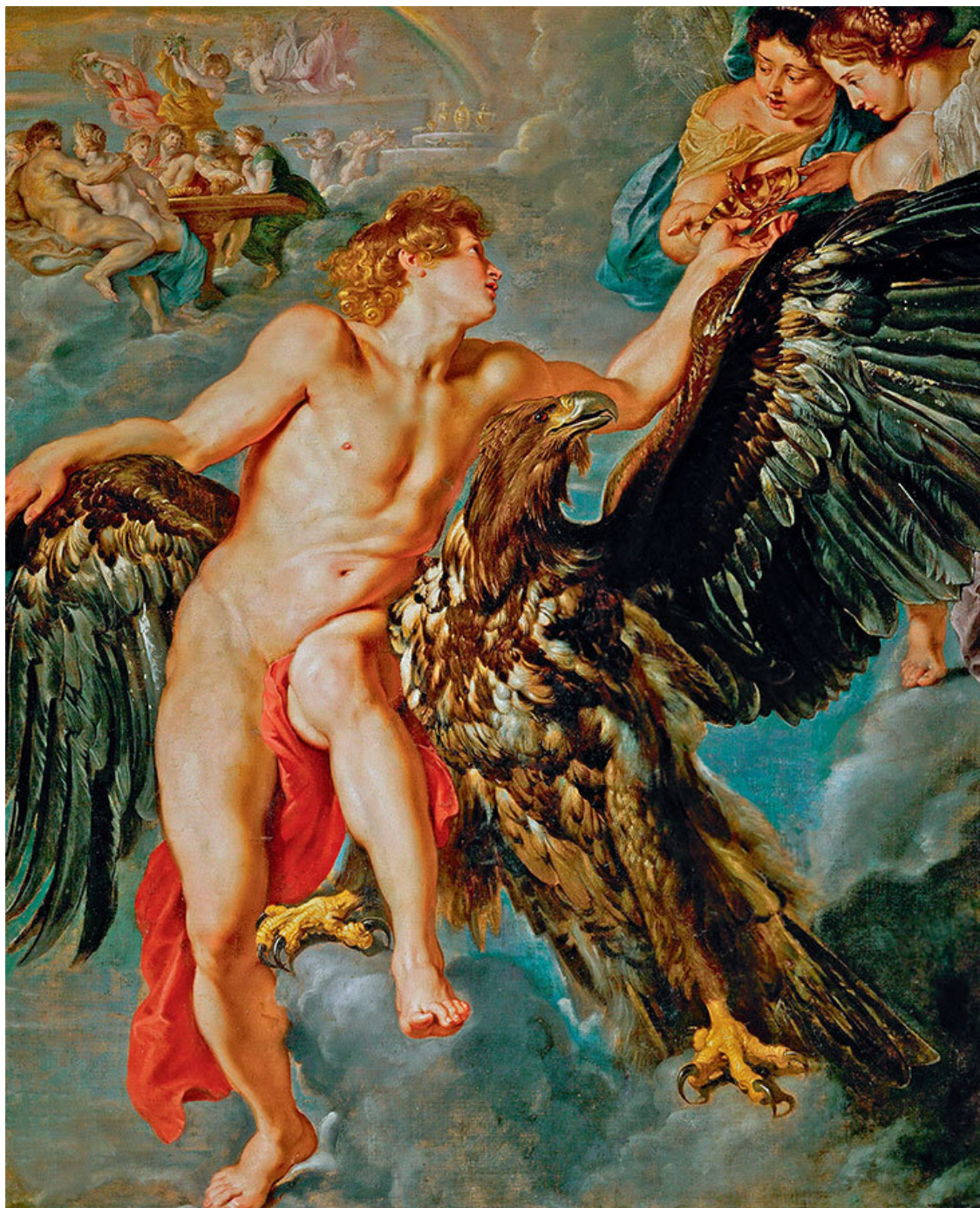
Питер Пауль Рубенс. Похищение Ганимеда. 1611–1612 гг.

Властитель этого царства Аид сидит на золотом троне со своей женой Персефоной. Ему служат неумолимые богини мщения Эринии. Грозные, с бичами и змеями, преследуют они преступника; не дают ему ни минуты покоя и терзают его угрызениями совести; нигде нельзя скрыться от них, всюду находят они свою жертву. У трона Аида сидят судьи царства умерших – Минос и Радамант.