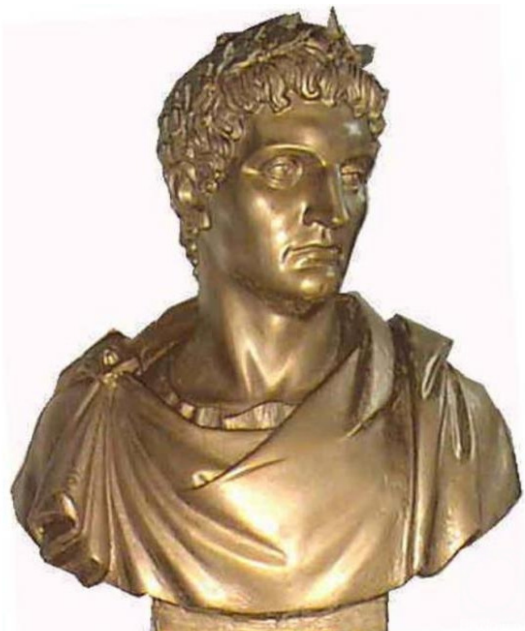
Крашенный бюст Овидия Назона, копия

Великий римский поэт Публий Овидий Назон (43 г. до н. э. – 17 г. до н. э.) выступает как наставник любовной науки, подробно разъясняющий правила флирта, которые по своей внутренней сути мало изменились за последние тысячелетия. За скандальное произведение, противоречащее официальным воззрениям на любовь и брак, поэт был отправлен в ссылку императором Августом. Проходил ссылку – в устье Дуная, среди варваров – скифов. Имя Овидия неоднократно упоминает А.С.Пушкин.