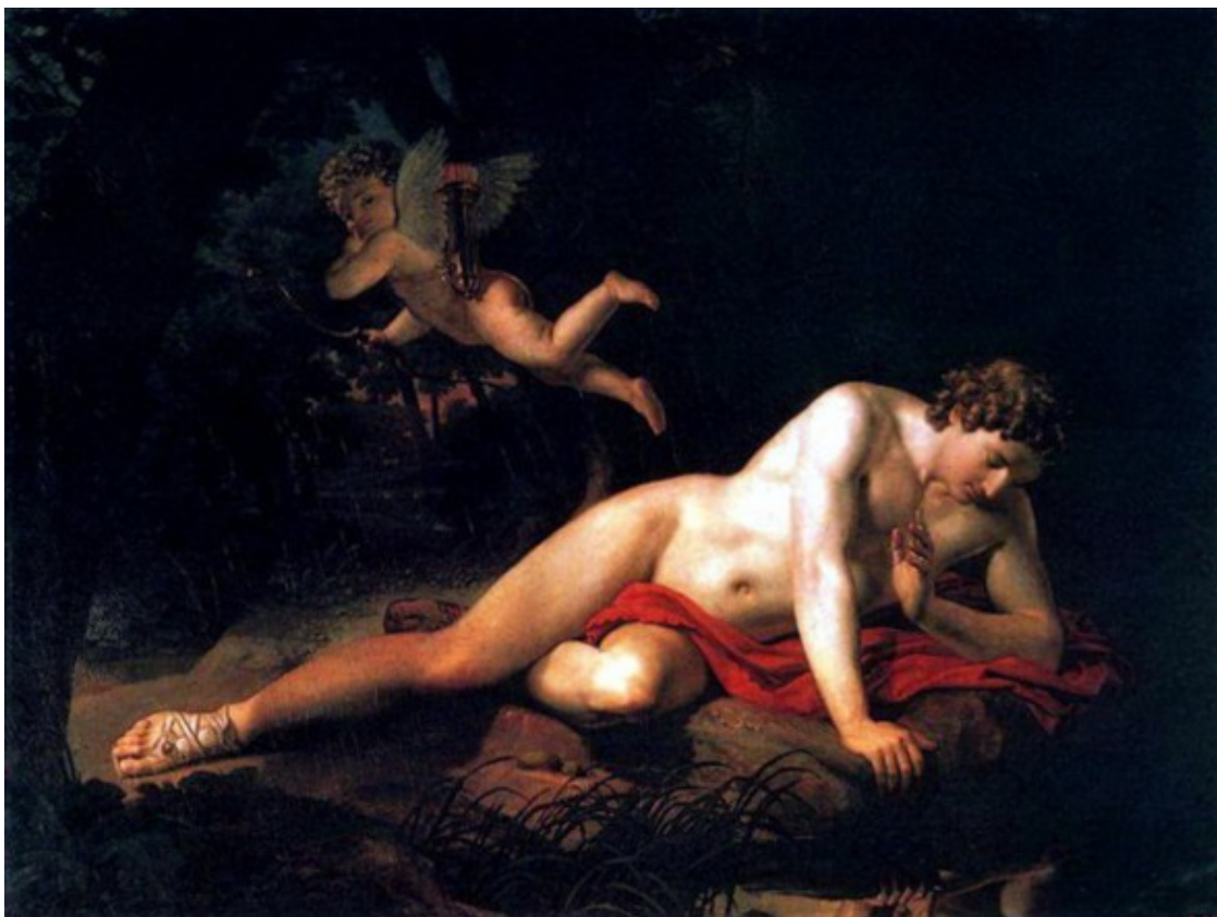
Карл Брюллов Нарцисс

Все более счастливого удела; Весна прошла, надежда оскудела — И невозможен новых сил приток.