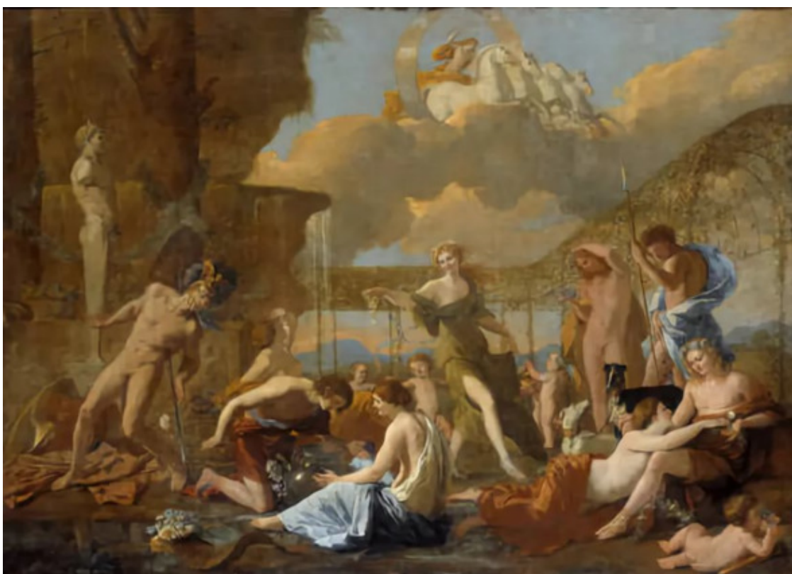
Пуссен Царство Флоры

Горько старухой стыть на одиноком одре! Не затрещит твоя дверь под напором ночного гуляки, Не соберешь поутру россыпи роз под окном. Ах, как легко, как легко морщины ложатся на кожу, Как выцветает у нас нежный румянец лица! Прядь, о которой клялась ты: «Была она с детства седою!» — Скоро по всей голове густо пойдет сединой. Змеи старость свою оставляют в сброшенной коже, Вместе с рогами олень ношу снимает годов; Только нам облегчения нет в непрерывных утратах — Рвите же розы, пока в прах не опали они! Да и рождая детей, становится молодость старше: Жатву за жатвой даря, изнемогают поля.