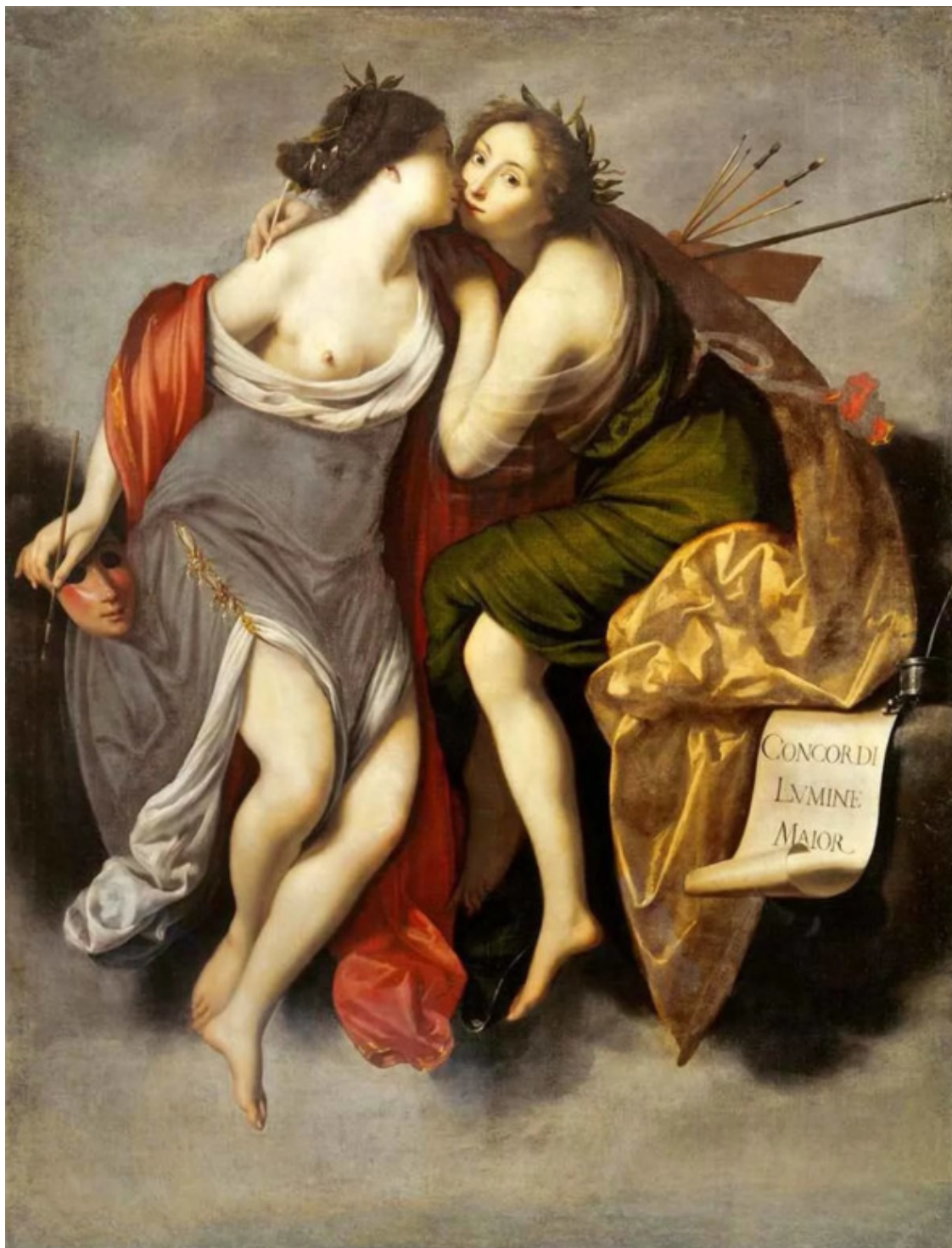
Франческо Пурины маска