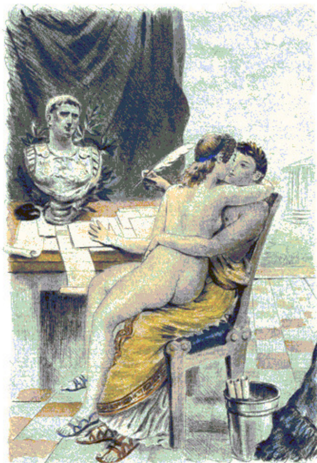
Поль Эмиль рисунок

Так, и только так, миром закончится брань. Вволю побуйствовать дай, дай ненависть вылить воочью И укроти ее пыл миром на ложе утех. Там – согласия храм, там распря слагает оружие, Там для блага людей в мир рождена доброта. Так, побрянись, голубок и голубка сольются устами И заворкуют вдвоем, нежную ласку суля.