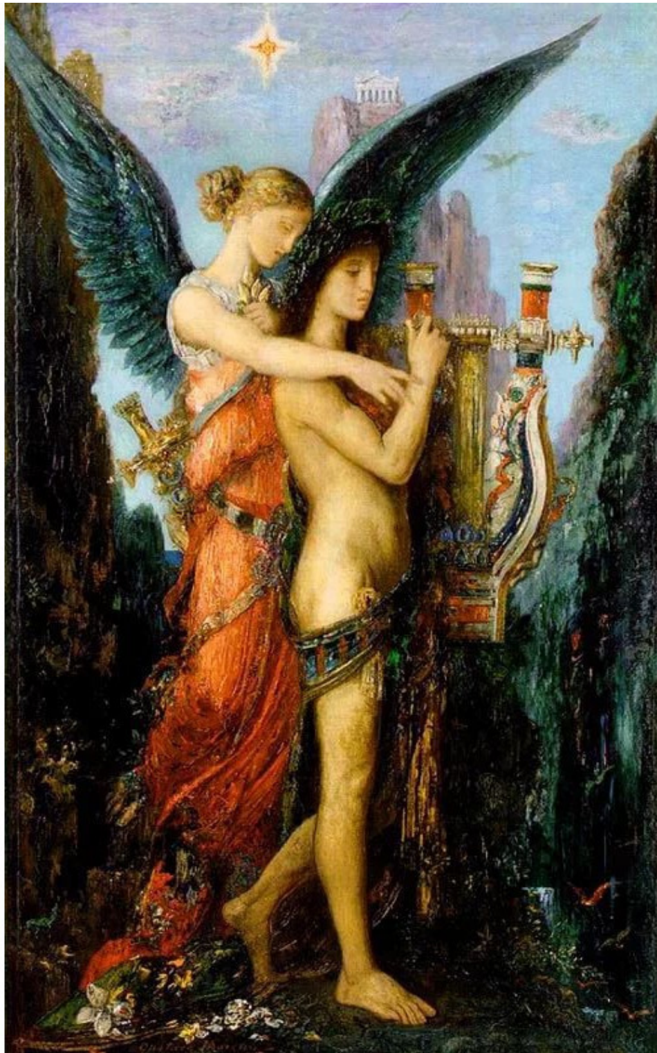
Моро Гюстав Гесиод и муза