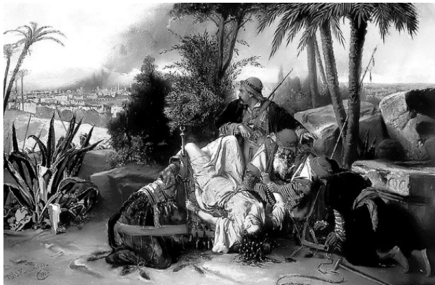
Пленница. Художник Ян Баптист Гюисманс

ла многое: любовь, счастье, смерть близких, предательство и безграничную власть.