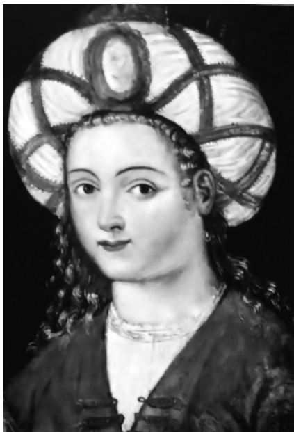
Один из портретов Роксоланы

Возможно, вполне умышленно. А так ли это – мы узнаем по ходу написания этой книги.