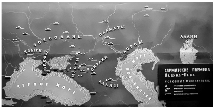
Карта расселения сарматских племен

Михаил Литвин (Mikhalon Lituan), посол Литвы в Крыму в середине XVI века писал в своей хронике 1550 года: «... любимая жена турецкого императора, мать его старшего сына и наследника, была в свое время похищена из наших земель».