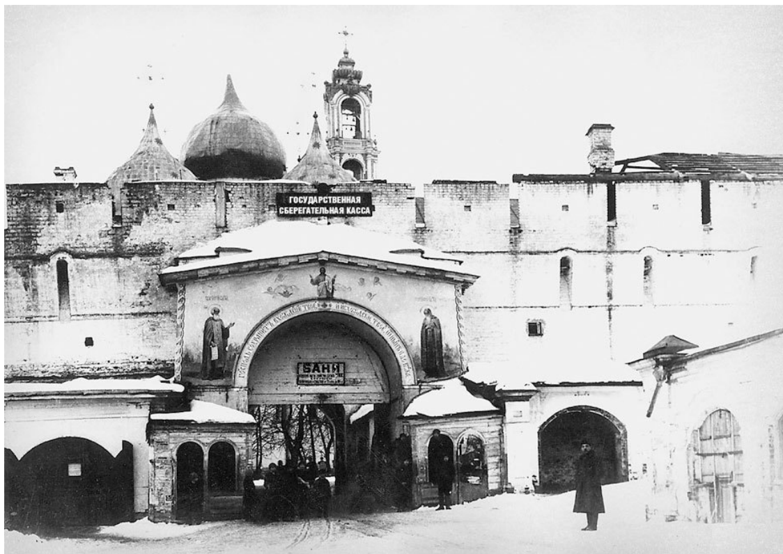
Над святыми воротами Лавры таблички с надписями «Бани» и «Государственная сберегательная касса»; после 1918 г.