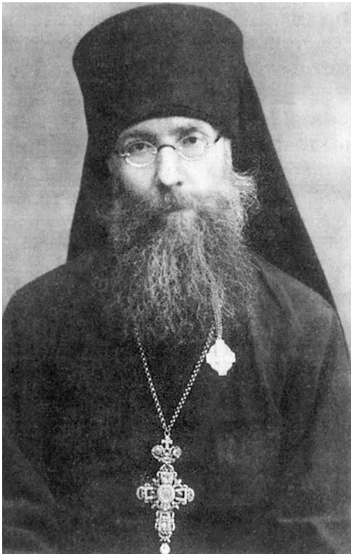
Архим. Вениамин (Миров; † еп. Саратовский и Балашовский)