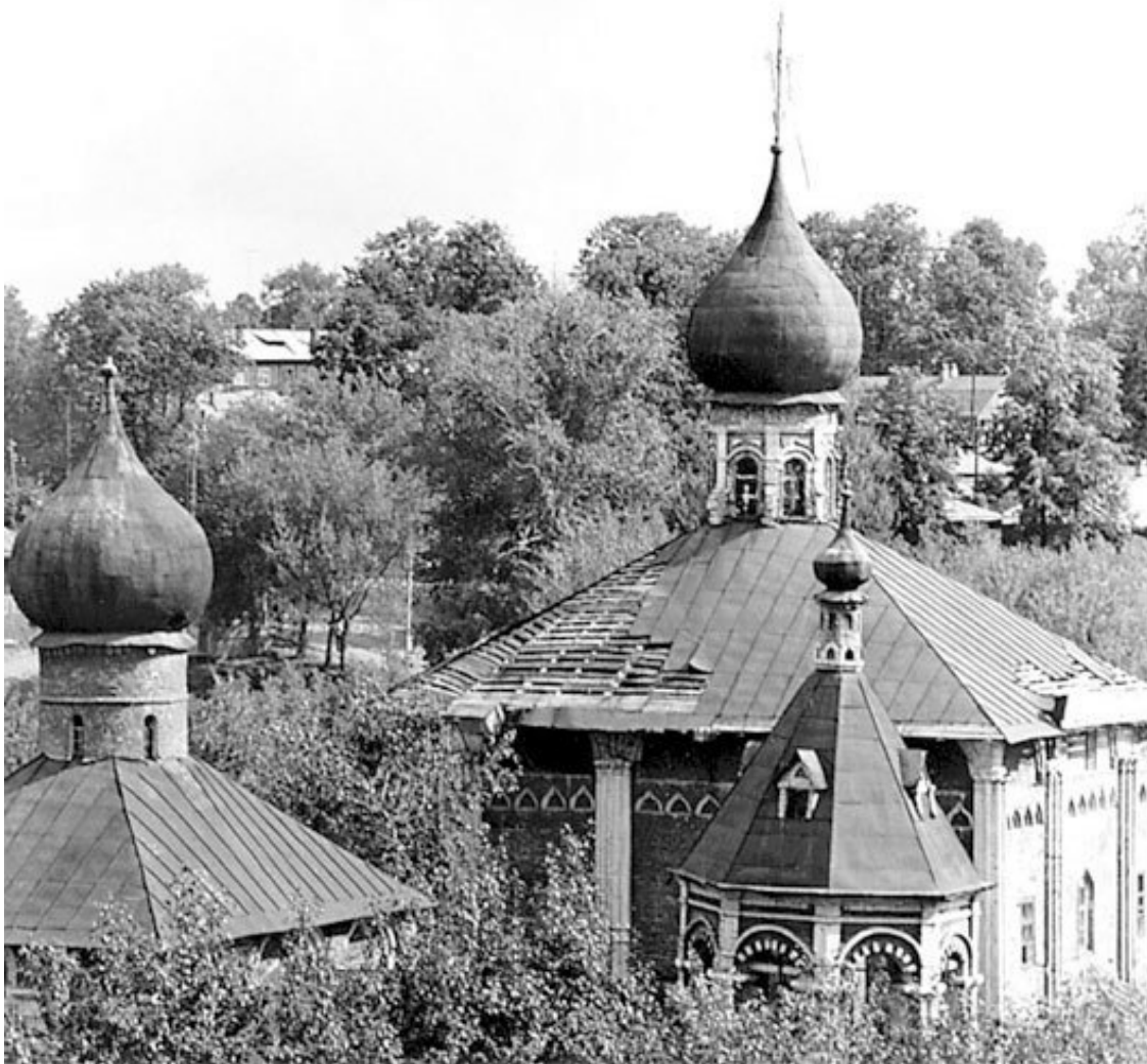
Пятницкие церкви «малая Лавра», 1950-е гг.

К 1926 году оставленные при музее монахи были уволены. В мае 1928 года Пятницкие церкви закрыли. Летом 1927 года были сброшены с лаврской колокольни колокола-великаны (4025, 1800, 1200 пудов) 24 .