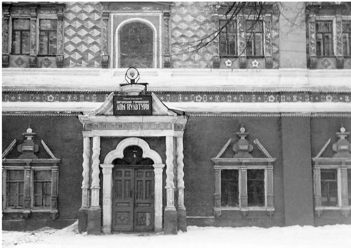
«Дом культуры» – чертоги (здание МДА)