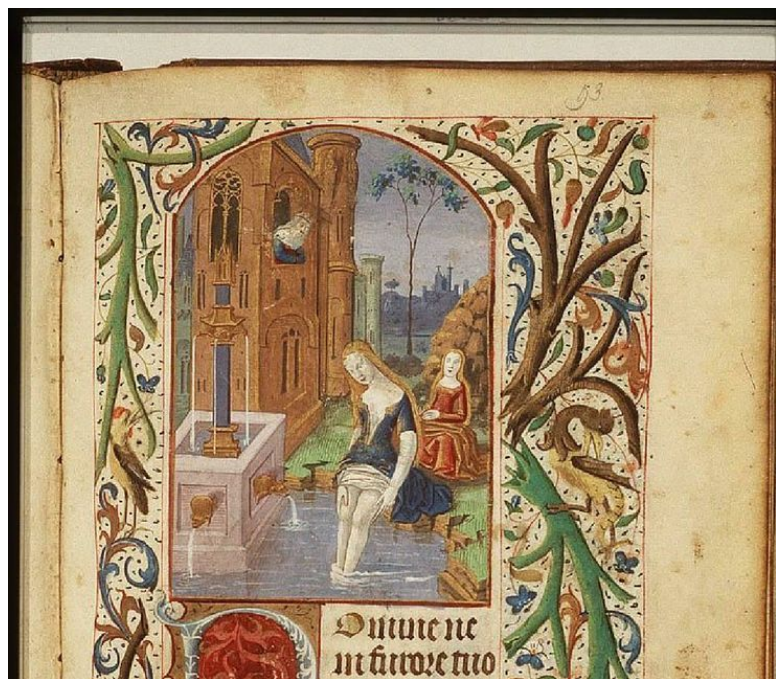
Глава Вторая Камино дел Норте Германия, XIII век.

щен от варваров и разбойников и специальный рыцарский орден охраняет всех паломников от грабежей и разбоя. И именно с этими словами в сердце Марты созрела уверенность, что она пойдет путем святого Якова.