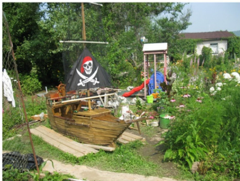
«Чёрный Паук» ещё без вант и косых парусов. 28 июля, 2014 г.