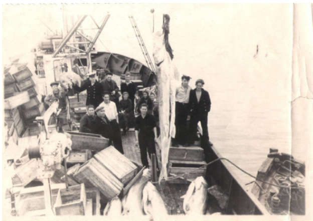
Белуги на палубе нашего судна

Эта рыба называется « Белуга », она из семейства осетровых . Это – самая древняя и самая крупная рыба на Земле. Она занесена в Красную книгу . Это значит – она охраняется всеми странами Мира. « Ростом » белуга бывает до 5 метров, а весом – до двух тонн!