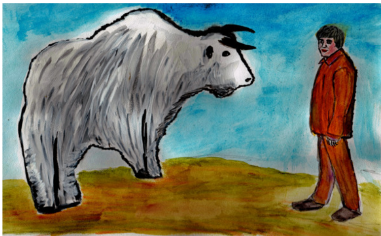
Хаят и бычок

Оклуш подпрыгнул и взвыл от боли – он вырвался и понёсся на Хаята. Испугавшись, Хаят побежал от быка.