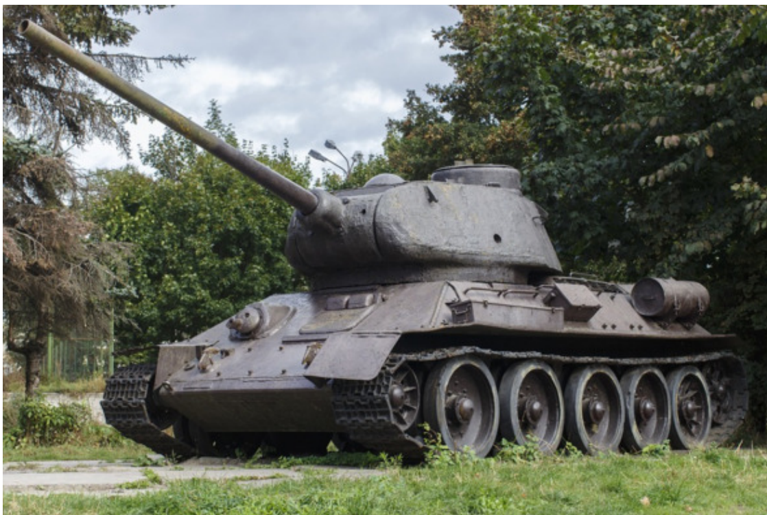
Рис. 5. Танк Т-34.

Как показывает опыт, компромиссное решение лишь откладывает необходимость разрешения противоречия, но не снимает проблемы. Со временем противоречие нарастает, обостряется, и в конечном итоге возникает необходимость его радикального разрешения за счет нового технического решения. Появление ручного противотанкового кумулятивного оружия обострило ситуацию настолько, что компромиссное решение перестало удовлетворять танкистов. Кумулятивные снаряды и бомбы прожигали любую броню. Появилась необходимость разрешения противоречия «толщина брони / маневренность танка», то есть создание «тонкой легкой брони», которая защищает танк от «сильного снаряда». Так появилась «активная броня».