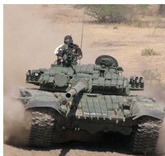
Рис.6. Танк Т-72 с активной броней.

Активная броня – разновидность защиты боевых бронированных машин. Она состоит из металлических контейнеров, содержащих элемент динамической защиты, который состоит из двух слоёв взрывчатого вещества и тонкой металлической пластины, расположенной между ними. Принцип действия активной брони состоит в том, что контейнеры со взрывчаткой, установленные поверх обычной брони танка, взрываются «навстречу» летящему в танк снаряду, в тот момент, когда снаряд попадает в них.