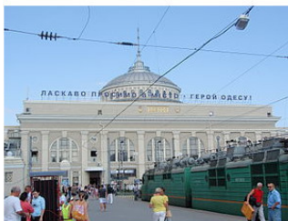
Рис. 1. Знаете, он там будет, даже если вы туда не пойдете

– Знаете, он там будет, даже если вы туда не пойдете.