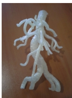
Рис. 8. Аорта.

Чтобы разрешить противоречие, необходимо провести анализ технической системы и противоречий, связанных с ней. Начнем с уточнения условий, в которых возникают и действуют противоречивые требования, то есть оперативного времени и оперативной зоны. При рассмотрении работы любой системы, нетрудно видеть, что она далеко не всегда работает в одинаковых условиях, и с одинаковыми параметрами. Поэтому, например, условно все время работы технической системы можно разделить на такие промежутки T1, T2 и т.д., в течение каждого из которых все характеристики системы одинаковы или однородны. Так же надо поступить и с пространством, разделив его на зоны S1, S2, и т. д. где требования одинаковы.