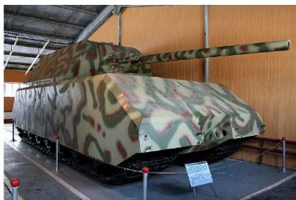
Рис. 4. Танк «Маус» (музей в Кубинке)

Иногда конструкторы выбирают в качестве приоритета один из параметров и пытаются улучшить только его. Именно так был создан немецкий танк «Мышонок».