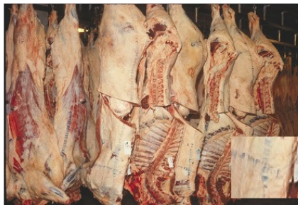
Рис.3. Туши с клеймом

Мясные туши необходимо маркировать, чтобы гарантировать прохождение ветеринарного контроля. И никакие бирки тут недопустимы, так как они могут потеряться при транспортировке. А вот чернильное клеймо – гарантия, что маркировка будет сохранена. Но тут и возникает проблема. После продажи, при приготовлении пищи, это клеймо приходится срезать и выбрасывать (ведь чернила-то не очень полезны для здоровья). Это значительные потери, приходится срезать печать вместе с куском мяса. Необходимо предложить иной способ маркировки мяса!