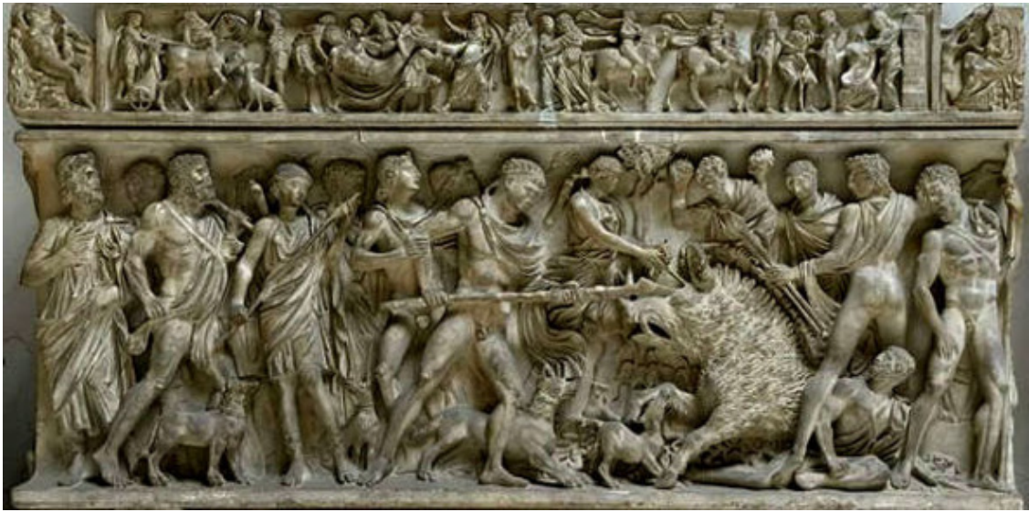
Калидонская охота. Рельеф римского саркофага. Мрамор. 190—200гг. Рим, Палаццо Дория.

Осерчал Аполлон на великого героя, разозлился до такой степени, что взял свой серебряный лук, вложил в него золотую стрелу, натянул тетиву и... поразил Мелеагра в самое сердце, отправив душу незадачливого охотника в царство теней. Боги не любят неудачников.