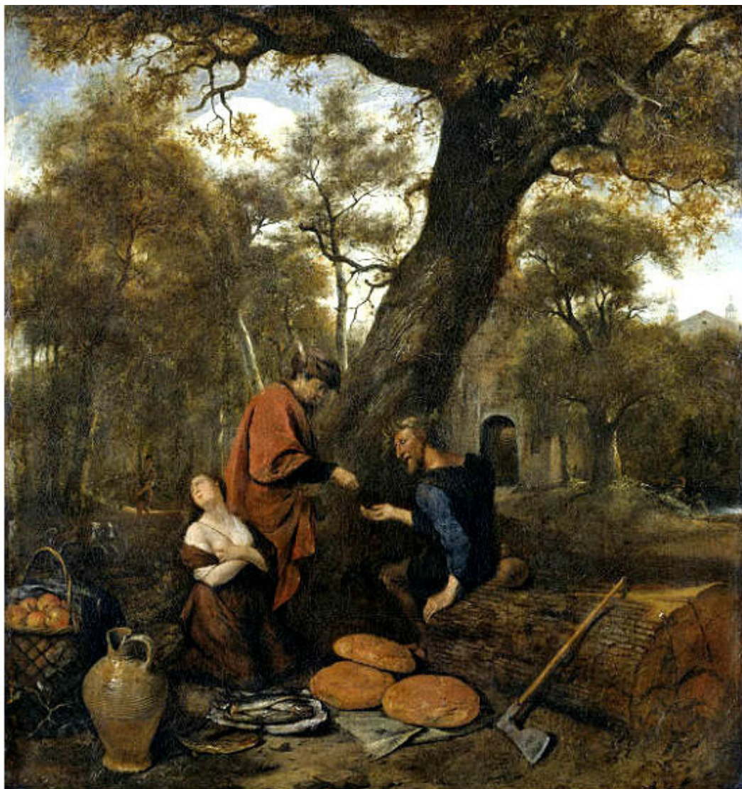
Ян Стен. «Эрисихтон продает в рабство свою дочь». 1650—1660. Рийксмузеум, Амстердам.