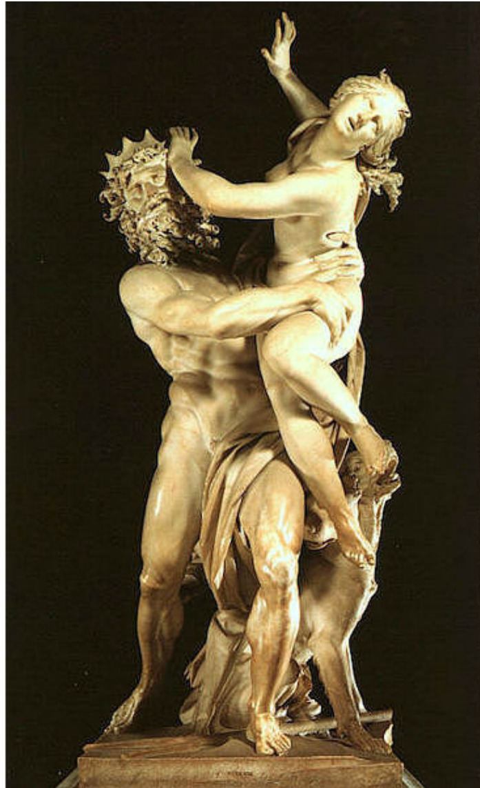
Джованни Лоренцо Бернини. «Похищение Прозерпины (Персефоны)». 1622. Рим, галерея Боргезе.