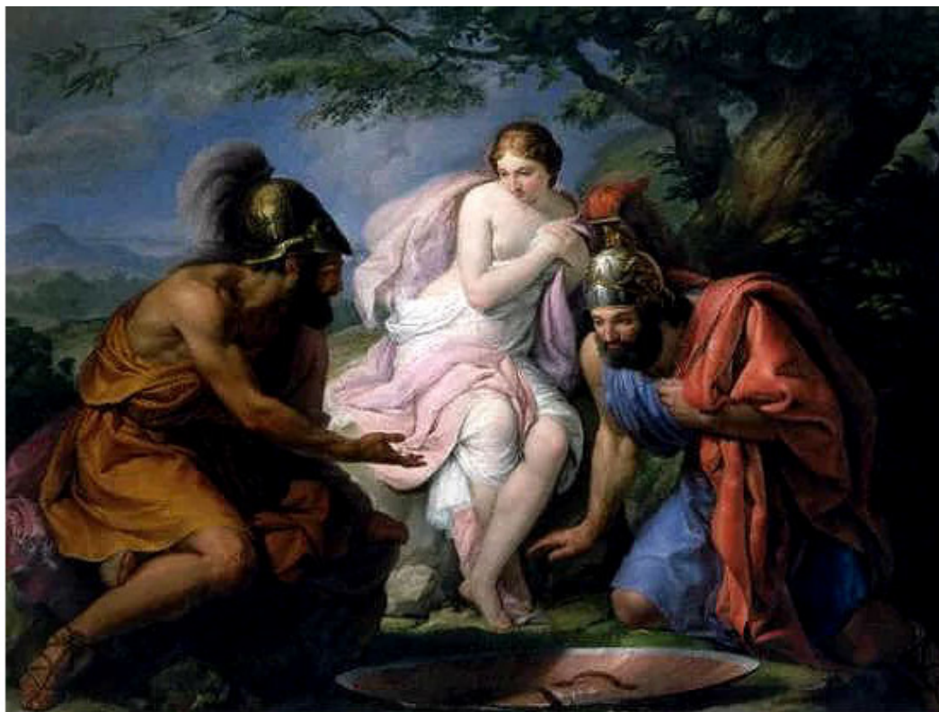
Тесей и Пейрифой кидают жребий.