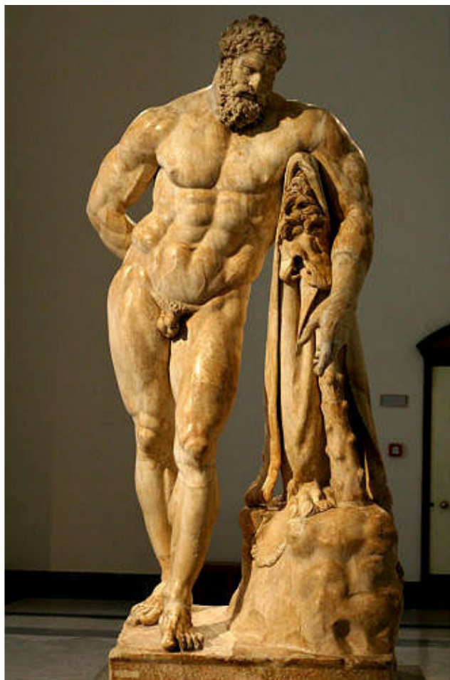
«Геркл отдыхающий». Мраморная римская копия III века н.э. с бронзового оригинала Лисиппа (IV век до н.э.). Национальный археологический музей в Неаполе.