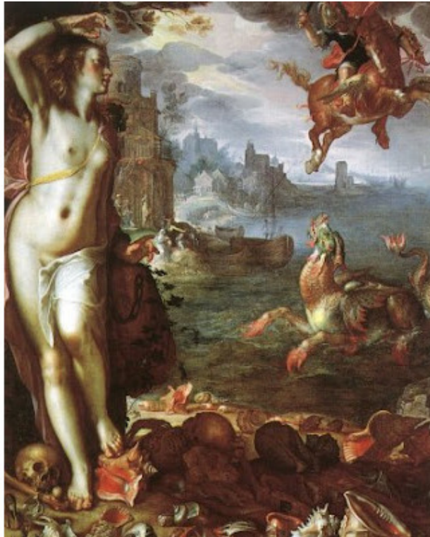
Иоахим Эйтевал. «Персей и Андромеда». 1611 г. Лувр, Париж

Персей метал диск последним. Публика, как зачарованная, следила за полётом тяжёлого снаряда. Тот уверенно набрал высоту, коснулся перистых облаков и пошёл на снижение. Дискбол чудодейственным образом придал плоскому кругляшу удивительную летучесть. В результате бронзовая штукавина спланировала не куда-нибудь, а точнёхонько в лоб зазевавшемуся Акрисию, поразив того насмерть. Вероломный дедушка был-таки отправлен рукой внука в царство теней.