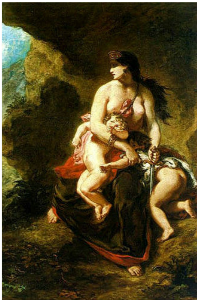
Эжен Делакруа. «Медея». 1862г.