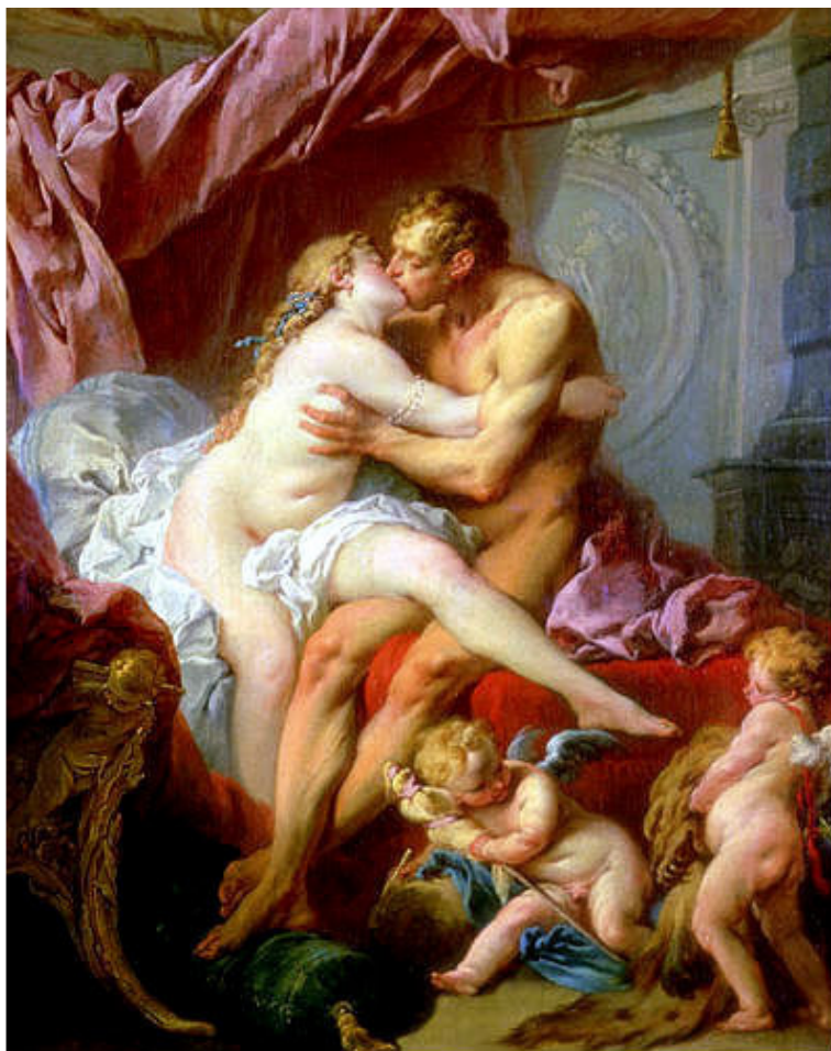
Франсуа Буше. «Геракл и Омфала». 1731—1734 гг. ГМИИ им. А.С.Пушкина, Москва.