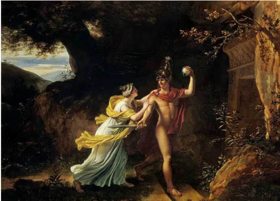
Жан-Батист Реньо (1754—1829). «Ариадна и Тесей». Музей изящных искусств, Руан

Позже выяснилось: это ошибка. Но изменить уже ничего было нельзя. Пришлось Тесею становиться царём, принимать бразды правления Афинами в свои руки. Море же назвали Эгейским. В память о случившемся.