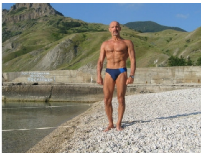
АВТОР НА 60 ГОДУ ЖИЗНИ

Но первые считают себя лучше, совершенней, а вторые, понимая, в глубине души, что идеал недостижим, все же бесплодно мечтают и страдают комплексом неполноценности. Очевидно, что бодибилдинг не путь к красоте, здоровью и гармонии.