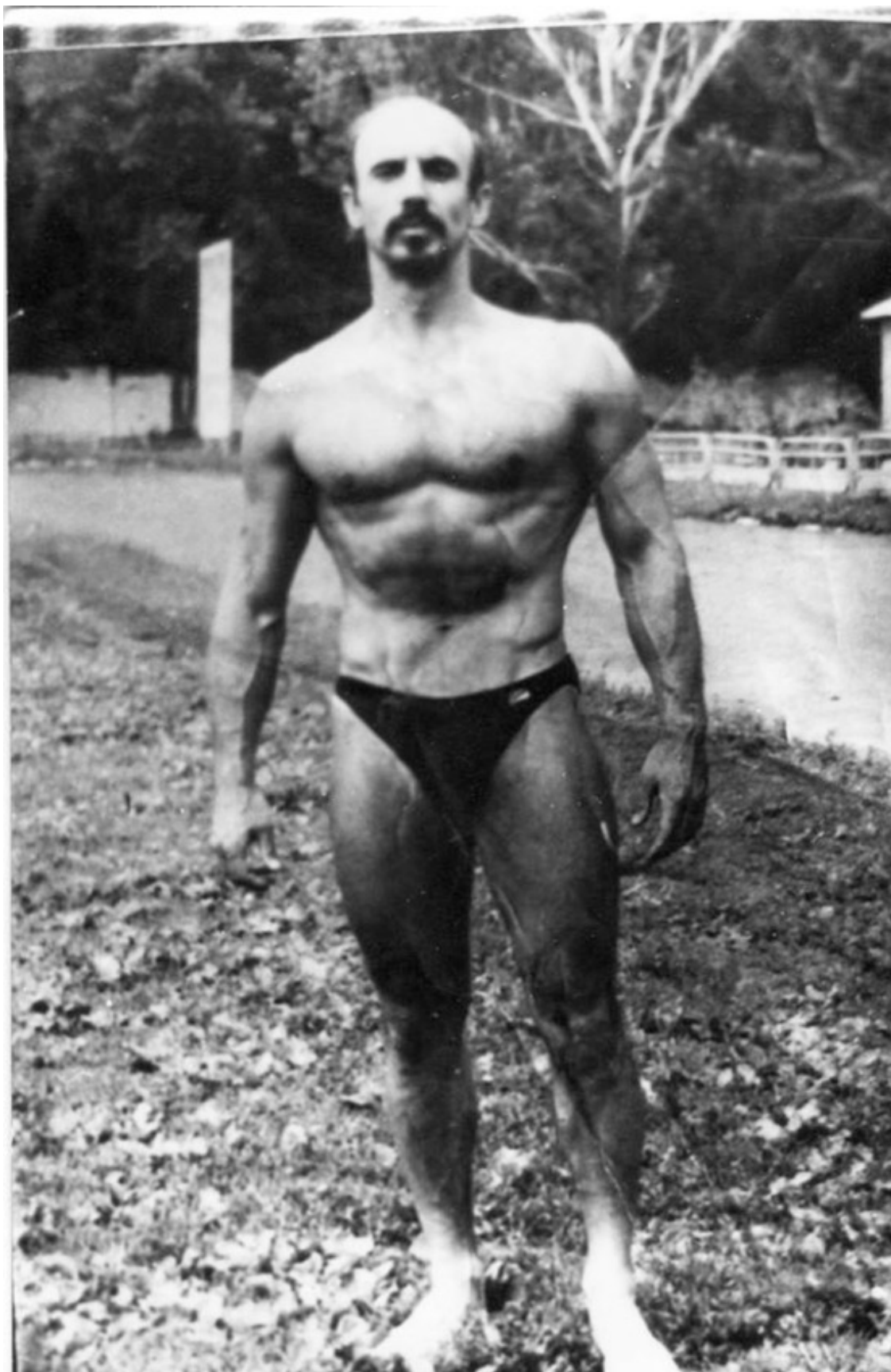
Автор в сорок лет.