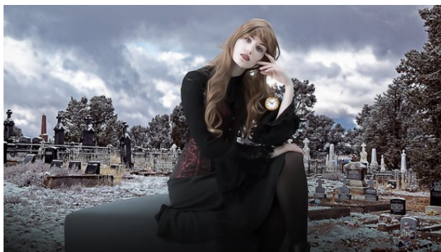
К «Поцелуй смерти»