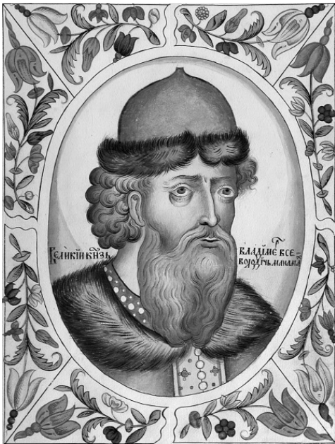
Вел. кн. Владимир Всеволодович Мономах. Рис. из Титулярника 1672 г.

Это был лучший период в истории южной, Киевской Руси, объединившейся под сильной рукой мудрого государственного деятеля. Однако сразу же после смерти Мстислава Великого снова начались междоусобицы. Великие князья в Киеве сменялись как в калейдоскопе. По всей Руси воевали мономаховичи с ольговичами, старшие мономаховичи – с младшими, в борьбу вмешивались и поддерживали то од-