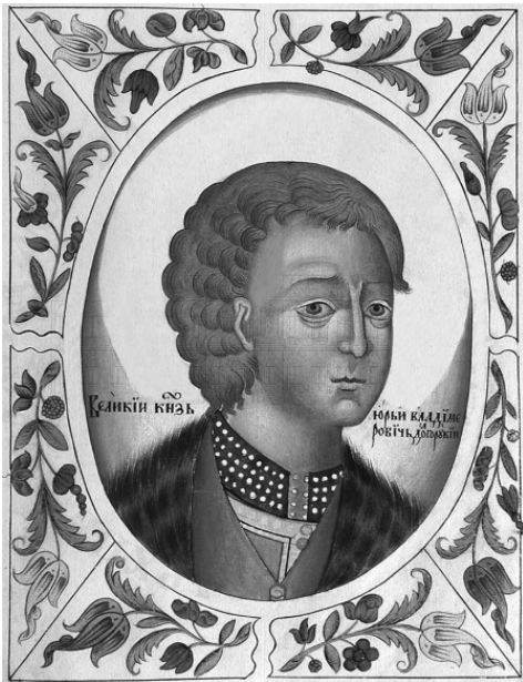
Вел. кн. Юрий Владимирович Долгорукий. Рис. из Титулярника 1672 г.

Князь Юрий Владимирович мало интересовался своей вотчиной, его манил златоглавый Киев, за который он вел долгую и неудачную войну со своим племянником, великим князем Изяславом Мстиславичем, сыном Мстислава Великого. Юрия Владимировича современники прозвали Долгоруким, оттого что из своего залесного захолустья он тянул свою длинную руку к Киевскому золотому столу, с этим