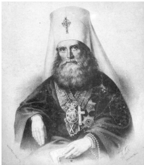
Святитель Филарет (Дроздов)

ние на процесс формирования русской национальной культуры, тем самым, пытаясь усилить влияние Церкви в русском обществе и воцерковить русскую культуру 1 .