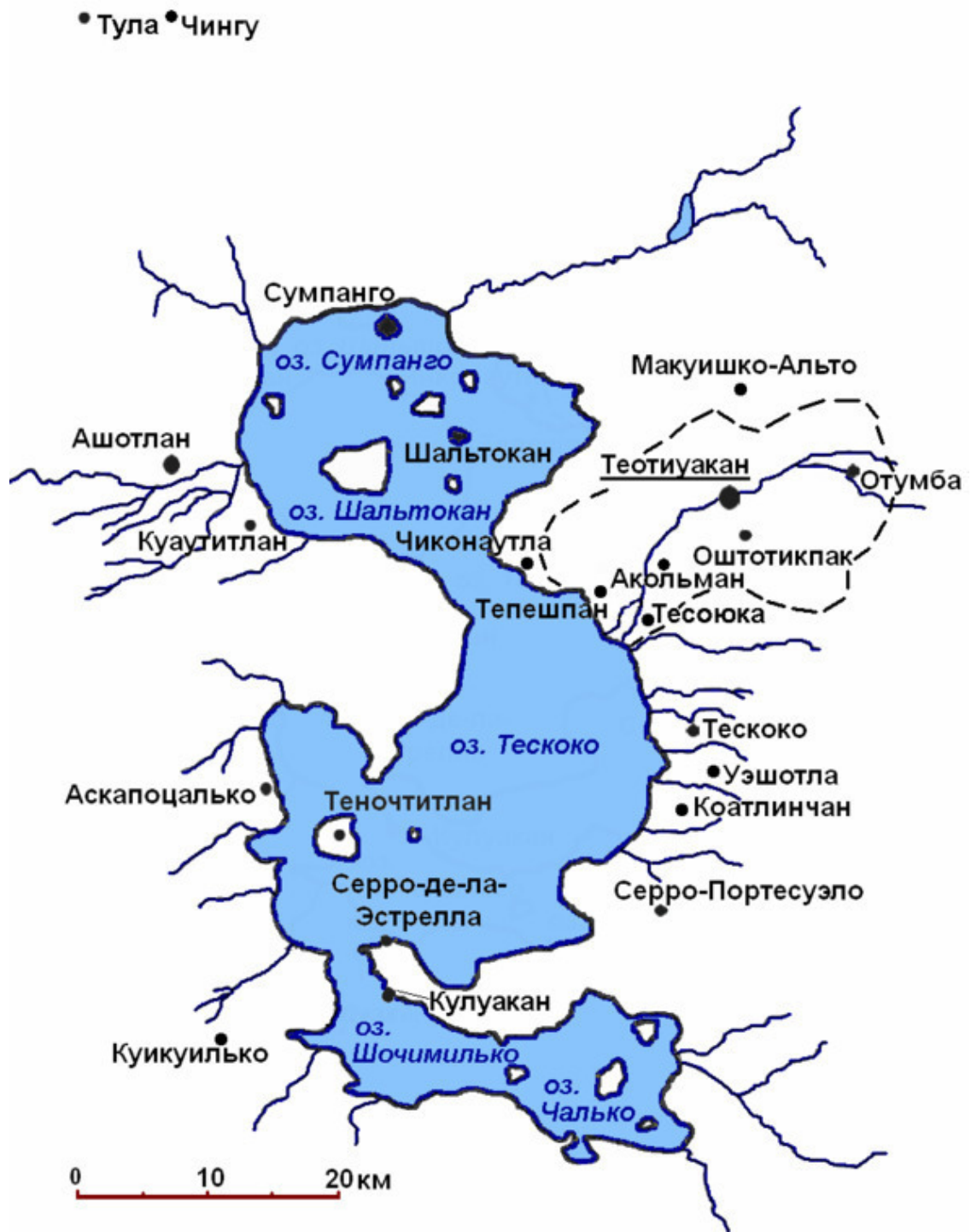
Карта долины Мехико в постклассический период с указанием месторасположения Тулы. Пунктирной линией отмечены приблизительные границы долины Теотиуакана (по S. Clayton «Gender and Mortuary Ritual at Ancient Teotihuacan, Mexico...»)

К концу XIV и началу XV вв. главным поселением на территории некогда великого города становится расположенный на северо-запад от Сьюдаделы Сан-Хуан-Теотиуакан, который оставался экономическим и политическим центром вплоть до колониального периода (и даже после). Возможно, релокацию административного центра из Сан-Матео в Сан-Хуан-Теотиуакан провёл тлатоани Уэцин, однако не исключено, что это дело рук Тотомоччина или даже Несауалькойотля.