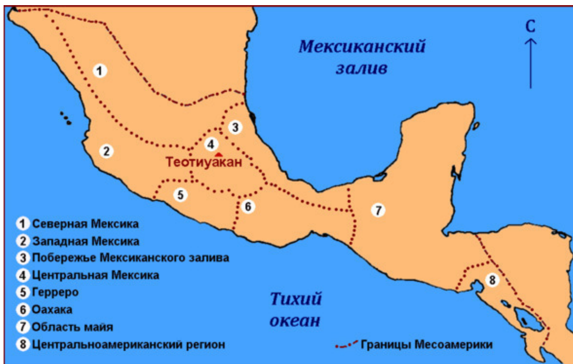
Месоамерика. Культурные регионы

Теотиуакан располагается в долине Мехико – культурно-географической области Месоамерики, включающей территорию вокруг системы неглубоких озёр и ограниченной горными грядами. По оси север-юг она растянулась на 110 км, а по оси восток-запад – на 80 км, занимая площадь около 8 тысяч км 2 . Если же рассматривать чисто географически и учитывать водоразделы, то площадь бассейна (долины) Мехико будет около 12 тысяч км 2 . В рамках этой области выделяют ещё и куда меньшую долину Теотиуакана, достигающую около 35 км в длину и занимающую площадь примерно в 500 км 2 . Ответ на вопрос, как зарождался Теотиуакан, нужно искать во временном периоде истории Месоамерики, который так и называется – формативным, то есть периодом становления. И хотя на рубеже II – I тысячелетий до н.э. будущей столицы империи ещё даже не намечалось, становление сложных обществ и развитие торговых месоамериканских сетей послужило началом в цепочке событий, которая в конечном итоге приведёт к появлению величайшего государства Центральной Мексики классического периода.