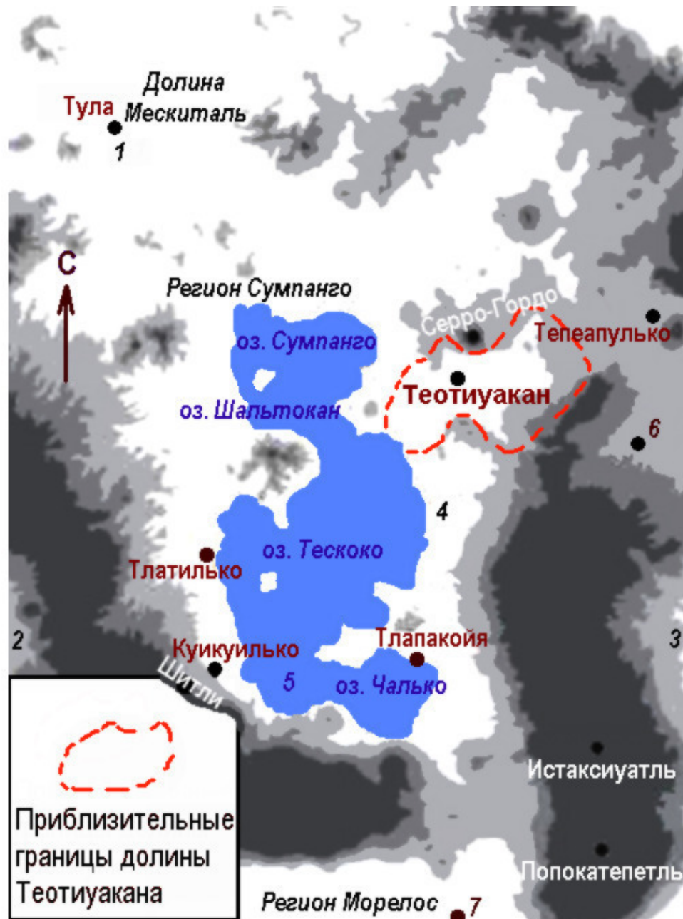
Долина Мехико и Теотиуакана: 1) регион Тулы; 2) долина Тoluка; 3) регион Пуэбла-Тлашккала; 4) регион Тескоко; 5) оз. Шочимилько; 6) Кальпулальпан (Лас-КолINAS); 7) Чалькацинго (по видоизменённой S. Vaughn карте L. Gorenflo из G.L. Cowgill «Ancient Teotihuacan...», 2015)

на юге – больше, в самой же долине Теотиуакана, расположенной примерно в 2300 м над уровнем моря – около 600 мм с резким делением на сезоны дождей и засухи. Богатые озёрные ресурсы Тескоко позволяли несколько нивелировать недостатки прохладного климата, однако территория в 20 километрах от озера, где в будущем появится Теотиуакан, в рассматриваемую эпоху была маргинальной.