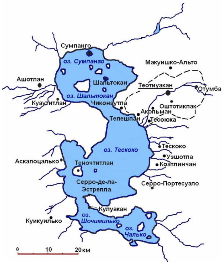
Карта долины Мехико в постклассический период с ука-