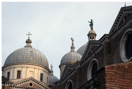
Кафедральный собор города Падуя

Расположенный по-соседству кафедральный собор был начат в стиле Возрождения в 1551 году, однако строительные работы затянулись вплоть до 1754 года, фасад так остался незаконченным. При нем имеется баптистерий XII в. с фресками Менабуои.