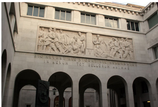
Во внутреннем дворе Падуанского университета

Пройдя по сувенирным лавкам, которых на площади довольно много я пошел гулять по городу. Открыты рестораники, кафе. Народ отдыхает, чему способствуют уличные музыканты. А что бы и нет.