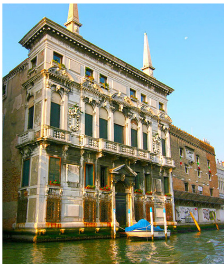
Дома на Большом Канале

Проплывая по большому каналу, я просто не мог не любоваться красотой старой Венеции. Очень красиво, особенно в утреннем солнце. Глядя на всю эту красоту мне подумалось; нет бы снести все это Унылое Историческое Дерьмо и построить торгово-офисные центры. Вот это было бы по-нашему, по-пацански. Ан нет! Ну тупые европейцы, тупые. Что с них взять. В Венеции существует закон; внутри здания еще в принципе можно перестраивать (и то, в крайнем случае), а вот внешние стены трогать нельзя. Памятник Юнеско. Это вам не деревянные «халупы» жечь.