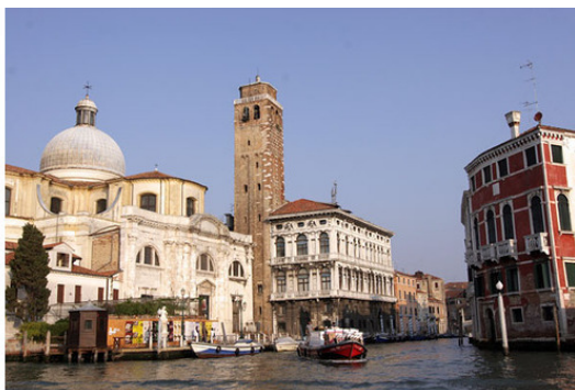
Большой Канал и примыкающие каналы поменьше

Проплывая по большому каналу, я просто не мог не любоваться красотой старой Венеции. Очень красиво, особенно в утреннем солнце. Глядя на всю эту красоту мне подумалось; нет бы снести все это Унылое Историческое Дерьмо и построить торгово-офисные центры. Вот это было бы по-нашему, по-пацански. Ан нет! Ну тупые европейцы, тупые. Что с них взять. В Венеции существует закон; внутри здания еще в принципе можно перестраивать (и то, в крайнем случае), а вот внешние стены трогать нельзя. Памятник Юнеско. Это вам не деревянные «халупы» жечь.