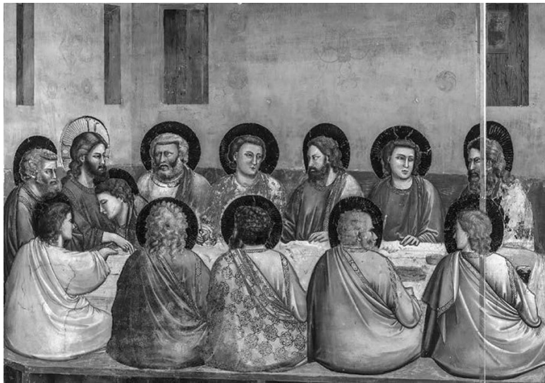
Тайная вечеря 1304–1306 гг.

Может быть Рим был только военной столицей, а культурной столицей был Константинополь? Тогда понятно, отчего итальянская живопись началась со следования византийской иконописной традиции.