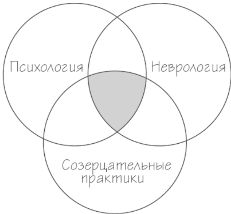
Рис. 1. Взаимное пересечение трех дисциплин

Ни одна книга не сделает ваш мозг мозгом Будды. Но вы сможете развить в собственном разуме/мозге больше качеств, связанных с радостью, заботой и мудростью, если разберетесь в том, как система мозг/разум работала у людей, которые уже достигли определенных высот на этом пути.