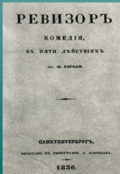
Первое издание «Ревизора» 1836 год