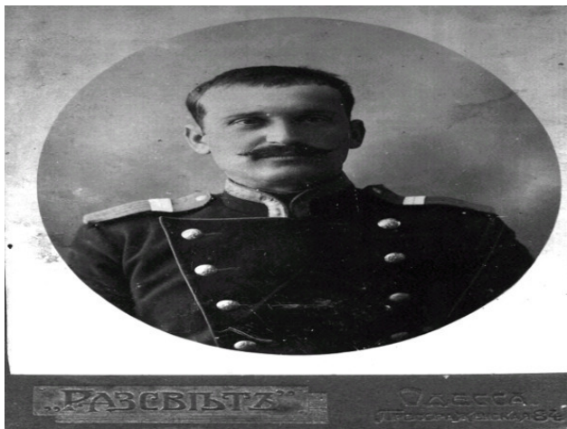
Русский солдат периода I мировой войны, фото из личного архива Тихомирова А. Е. Апрель 1916 года

21 марта в Астрахани начал работу 1-й съезд судовладельцев Волго-Каспийского района, связанный с взаимоотношениями между речными и морскими судовладельцами.