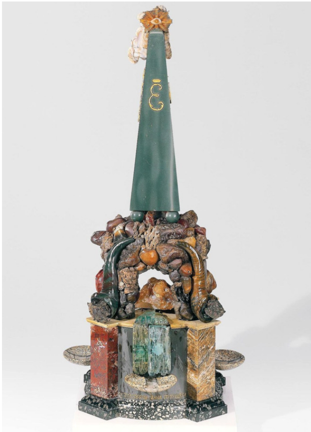
Грот-фонтан с вензелем императрицы Екатерины II

К концу царствования Екатерины современники уже писали – «...Во всех комнатах находятся так же картины и бо-