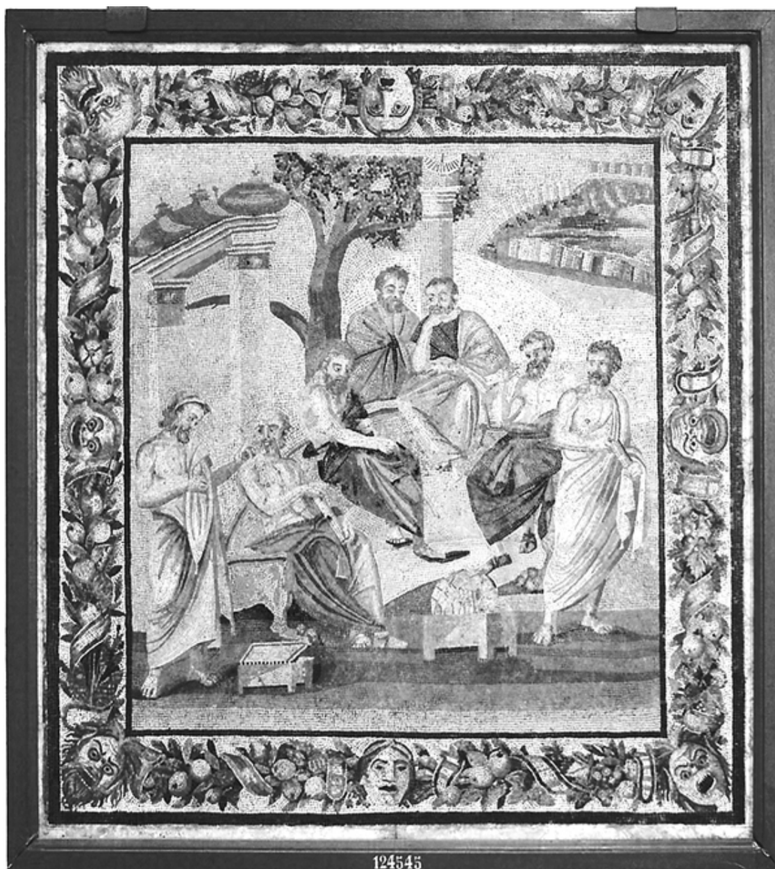
Мозаика «Платоновская академия»

Сократ. Следовательно, ты думаешь, между богами, в самом деле, бывали междоусобная война, страшная ненависть, боевые схватки и многое иное в таком же роде, о чем говорят поэты и чем пестро изукрашивают славные наши живописцы всякие священные предметы, между прочим, и тот пеплос, заполненный подобного рода узорами, который, во время Великих Панафиней, везут на акрополь 12 ? Скажем ли мы, Евтифрон, что все это – правда?