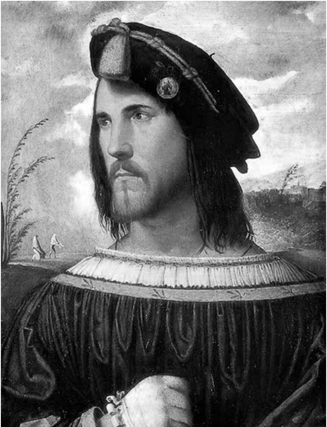
Джорджоне. Портрет Цезаре Борджа. XV в.

против испанцев, осаждавших Гаету. Он задумывал развязаться с Францией, и ему бы это весьма скоро удалось, если бы дольше прожил Папа Александр.