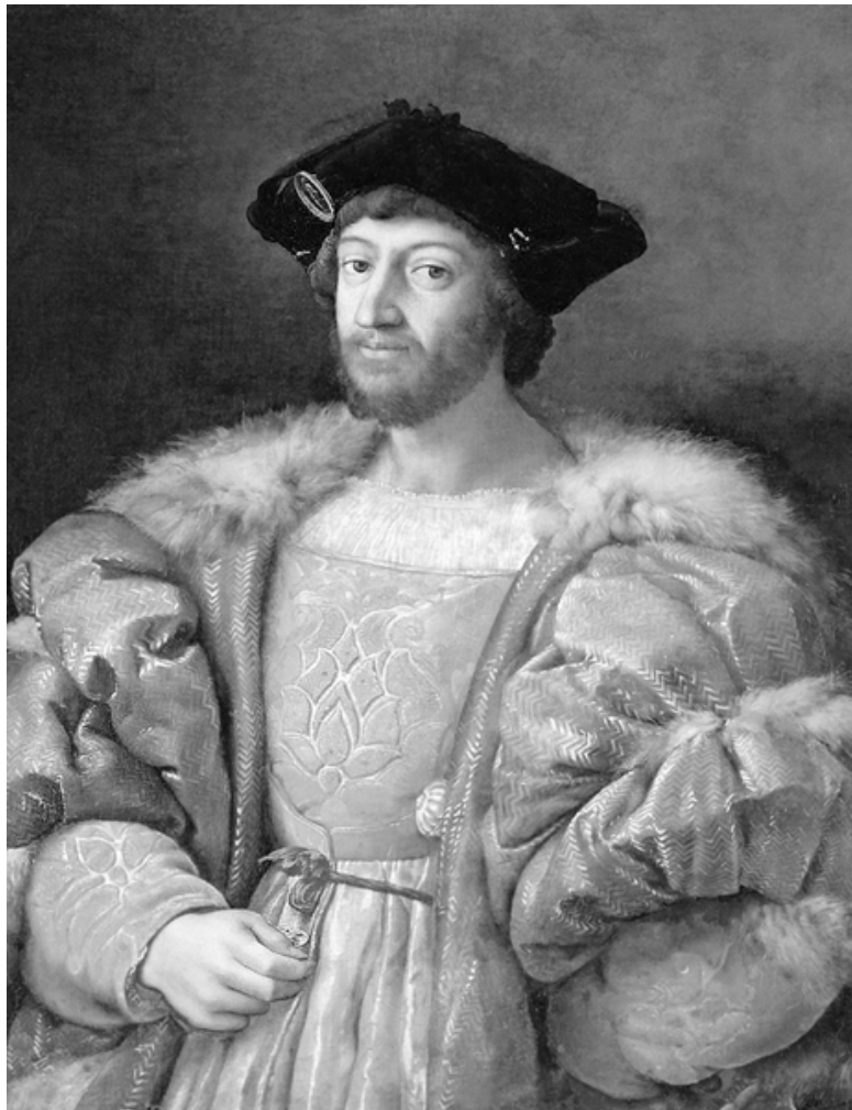
Рафаэль. Портрет Лоренцо деи Медичи. 1518 г.