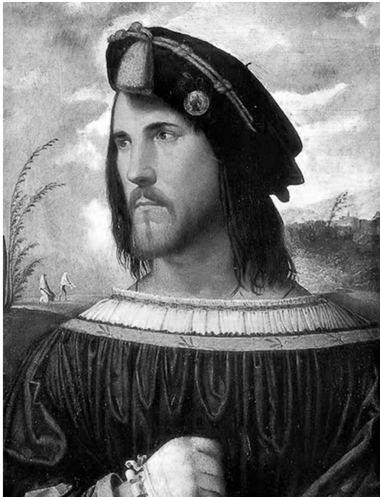
Джорджоне. Портрет Чезаре Борджа. XV в.