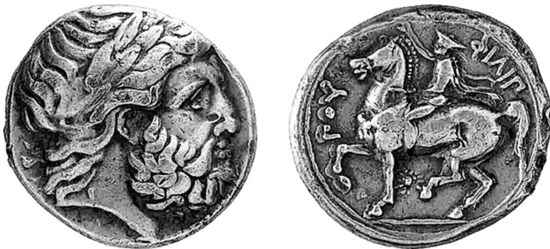
Серебряная тетрадрахма Филиппа II из музея в Фессалониках

Главную часть армии составляла громадная тяжеловесная македонская фаланга. В глубину фаланга имела 8, 10, 12 и даже 24 шеренги; чем больше была глубина фаланги, тем меньше было протяжение ее фронта. Движение такой фаланги требовало большой подготовки. Не случайно в македонской армии огромное внимание обращалось на боевую подготовку, особенно на подготовку командиров.