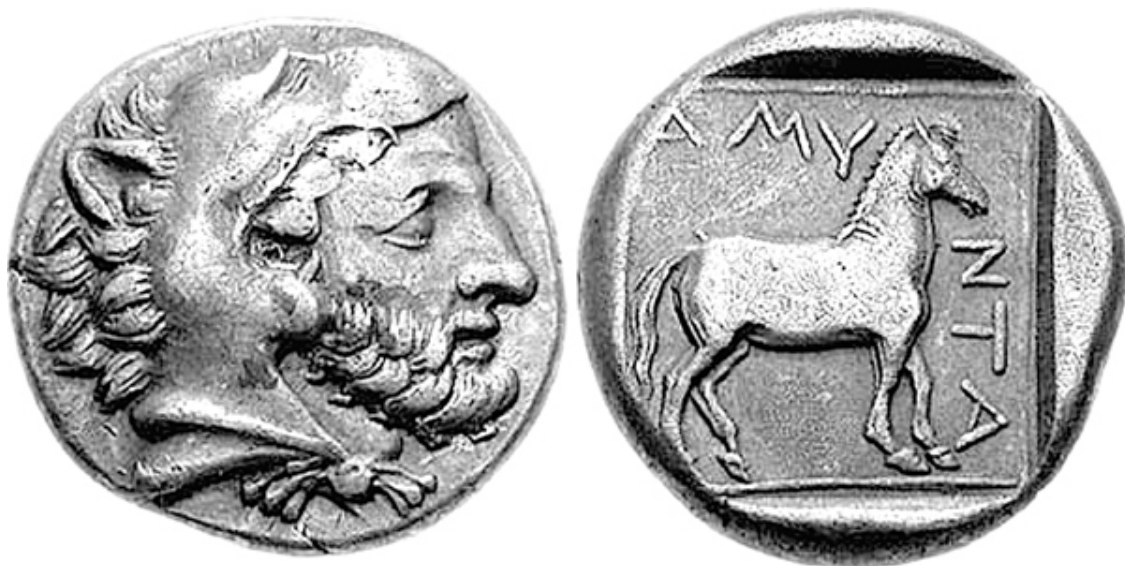
Монеты Аминты III