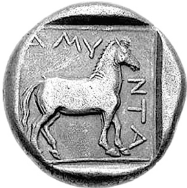
Монеты Аминты III