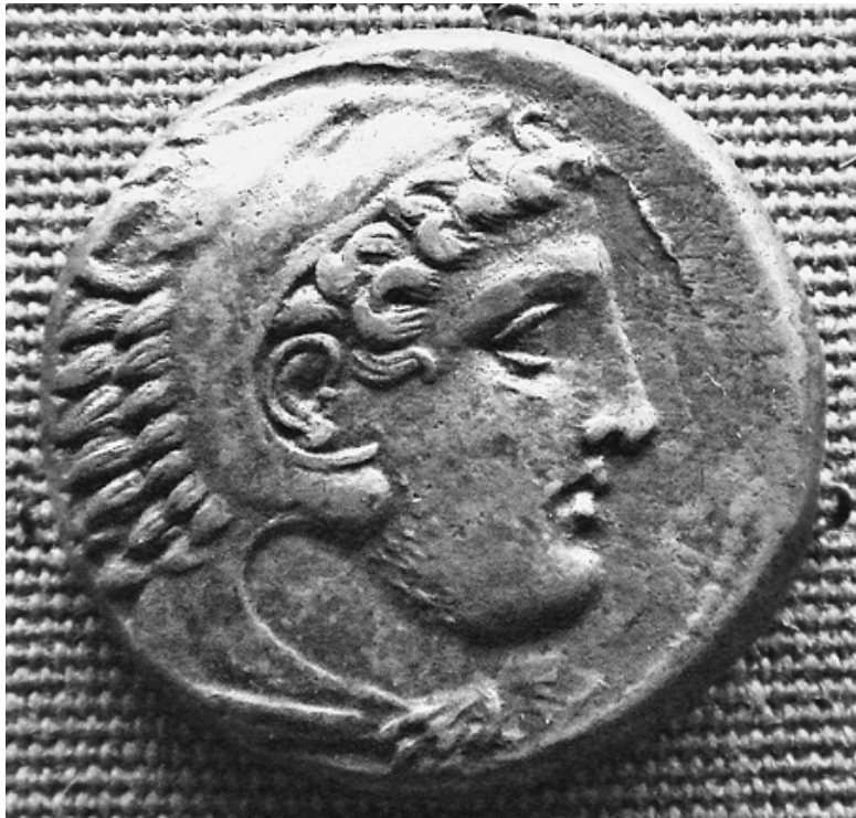
Монета древней Македонии при Пердикке III