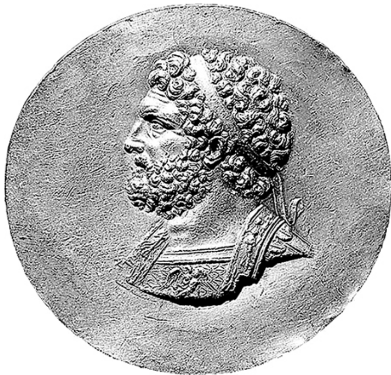
Золотой медальон с портретом Филиппа II