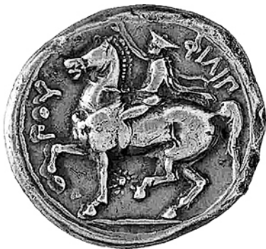
Серебряная тетрадрахма Филиппа II из музея в Фессалониках

Главную часть армии составляла громадная тяжеловесная македонская фаланга. В глубину фаланга имела 8, 10, 12 и даже 24 шеренги; чем больше была глубина фаланги, тем меньше было протяжение ее фронта. Движение такой фаланги требовало большой подготовки. Не случайно в македонской армии огромное внимание обращалось на боевую подготовку, особенно на подготовку командиров.