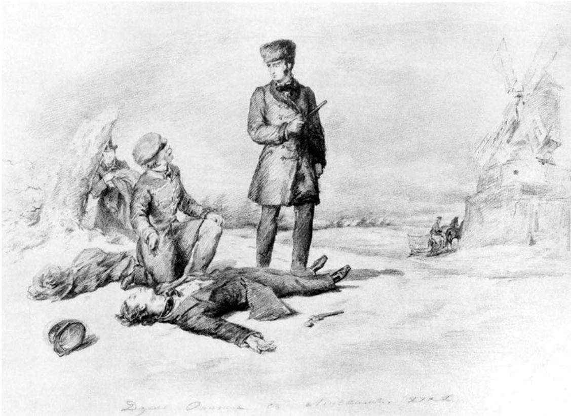
П. Соколов. Дуэль Онегина с Ленским. XIX в.