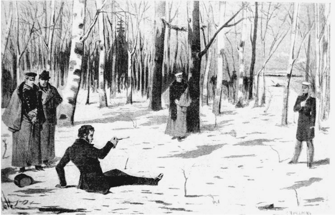
К. Чичагов. Конец дуэли

Если корпорация имеет главу, который считает оскорбление нанесенным ему лично, то он имеет право лично требовать удовлетворения, и оскорбитель не вправе отклонить вызов.