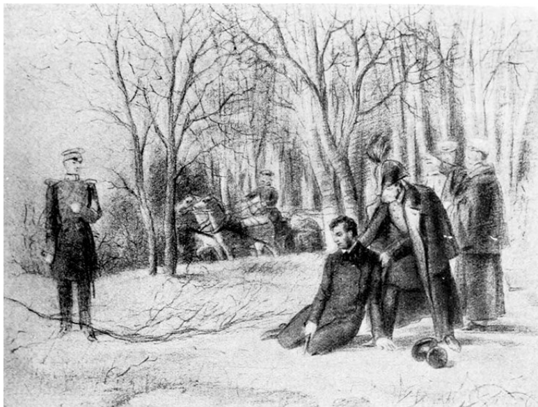
П. Соколов. Конец дуэли. XIX в.

Оскорбления имеют личный характер, и каждое лицо ответственно за нанесенное им оскорбление.