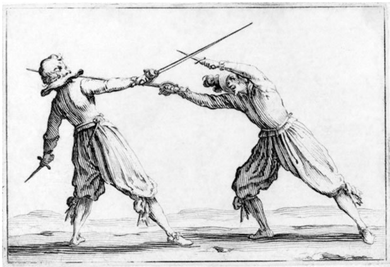
Ж. Калло. Дуэль на шпагах и кинжалах. 1622 г.