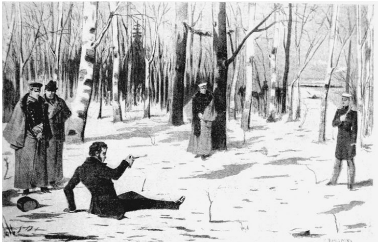
К. Чичагов. Конец дуэли