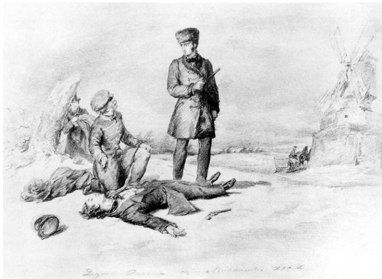
П. Соколов. Дуэль Онегина с Ленским. XIX в.