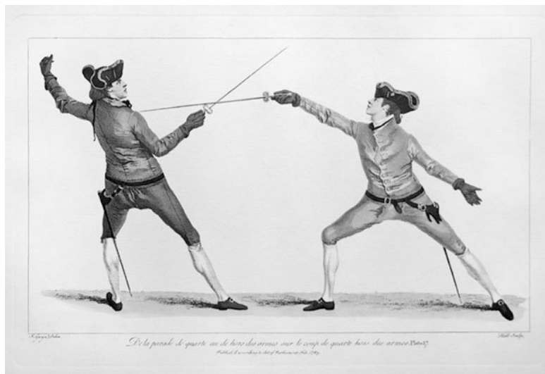
Тренировка фехтовальщиков. Гравюра. XVIII в.

Степень тяжести оскорблений второй и третьей степени, нанесенных недееспособным лицом, понижается на одну степень.