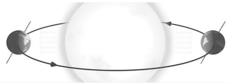
Правильное объяснение смены времен года (вне масштаба!!)

Теперь рассмотрим верное объяснение смены времен года. Дело в том, что ось вращения Земли находится под углом к плоскости орбиты, по которой она обращается вокруг Солнца. А это значит, что полгода северное полушарие повернуто к Солнцу, а южное – от Солнца и еще полгода – наоборот. Когда лучи Солнца в одном полушарии падают вертикально 11 (таким образом, на единицу площади поверхности приходится больше тепла), в другом они падают наклонно (и тепла туда попадает меньше).