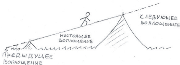
Рис 2 Эмоциональная эквилибристика

Смысл жизни человека напрямую обусловлен задачами его души, которая выбрала его тело, чтобы удовлетворить