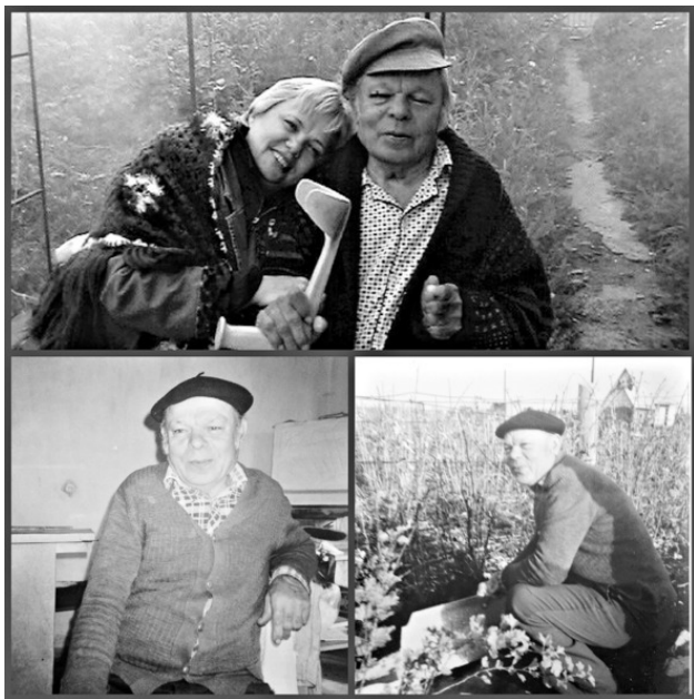
Верхнее фото: я с отцом: отец после инсульта на даче

нису и Славику. Мальчишки трудились, вкалывая в поте лица. Все взрослые ходили вокруг ребят и нахваливали работяг, не давая угаснуть их энтузиазму. Работа близилась к завершению, когда мы заметили, что отец как-то смущенно начал улыбаться и хмыкать. А потом появился сосед: «О! Прокопич, а зачем для бани-то фундамент?! Можно ведь и так!» Тут отец и раскололся: «Забыл, едрить твою масло! Можно, конечно, и на сваях по углам!»