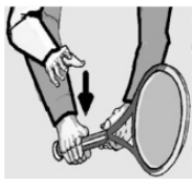
Континентальная (молотковая) хватка Большой палец зажимает сверху фалангу указательного пальца.

На начальной стадии обучения левым ударам над головой, применяют континентальную хватку. «Профи» используют хватку континентальную и левостороннюю восточную. Надо уметь автоматически менять хватку в момент принятия решения, какой удар будет выполняться.