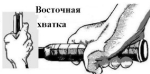
или хватка рукопожатием.