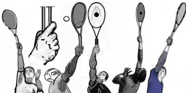
Рис. 3 Удар над головой тыльной стороной кисти

Вся сила левых ударов над головой в их точности и неожиданности, когда соперник расслабился после выполнения хорошей левой свечи.