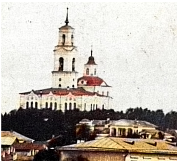
Вид храма Вознесения Господня, построенного взамен Вознесенской часовни в конце XVIII Века. Фото 1860-х годов

Но, церковная история этого места вновь перевернулась 17 сентября 1789 года, когда на имя екатеринбургского обер-коменданта генерал-майора Родиона Артемьевича Судовщикова поступило следующее прошение: «Здешнего города Екатеринбурга Вознесенской церкви «от прихожан всего общества и со священно церковнослужители. Покорнейшее доношение. Небезызвестно Вашему Превосходительству, что Вознесения Господня церковь пришла уже в ветхость, а по желанию нашему вознамерились построить вместо деревянной вновь каменную церковь, для которой и припасы изготовляются, как подле оной порозжего места нет, то по красоте города есть здесь в Екатеринбурге на горе против сказанной церкви бывшего главного командира Татищева и за ветхостью и со всем строением и каменною палаткою назначена в продажу. Чего ради Ваше Превосходительство и просим покорнейше, чтоб повелено было для строения вновь вместо деревянной к построению каменной церкви место отвести на горе, против упоминаемой Вознесенской церкви, в рассуждении красоты города, означенное же за ветхостью дом, во что будет оценен с торгу отдать церкви и на то наше доношение учинить милостивейшее рассмотрение».