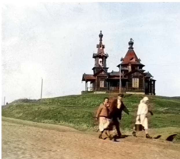
Вид Вознесенской часовни, перенесенной в Нижне-Исетский завод. Фото 1920-х годов

Но, ветхую прежнюю церковь все же не снесли. В 1808 году в екатеринбургскую духовную консисторию поступил запрос из Нижне-Исетского завода о разрешении перенести деревянную Вознесенскую Церковь на территорию завода «так как там церкви до сих пор не построено, а прежняя Вознесенская церковь стоит без прихода и без надобности». Так 19 мая 1808 года из Пермской духовной консистории последовал указ о перенесении деревянной Вознесенской церкви в Нижне-Исетский завод и освящение ее на антиминос 1783 года. Часовня была перевезена на новое место и 12 июля 1809 года освящена. Так и стояла «ветхая церковь» до тридцатых годов двадцатого века, когда и была уничтожена во времена богобоязности.