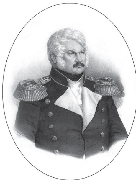
Алексей Петрович Ермолов генерал от инфантерии и артиллерии, русский наместник на Кавказе

«Высокочтимый имам, спешу доложить, что наши люди при свете дня и во тьме ночи бродят в окрестностях Шуры и Дженгутая, неустанно следя за намерениями врагов. Нам стало известно, что находившийся в Дженгутаяе при Ахмед-хане Мехтулинском отряд русских солдат вместе с ханом ушёл в Шуру. Там они присоединились к силам, находящимся в крепости. Через персиянина-торговца, который часто бывает в шуринском укреплении, мы узнали, что объединенные отряды гяуров собираются выступить в сторону Тарков. Да воспрепятствует им Аллах!»