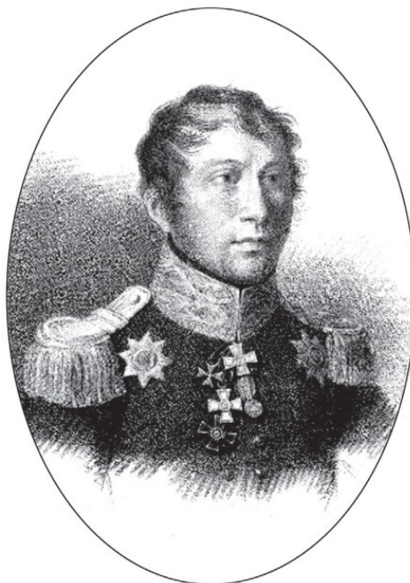
Григорий Владимирович Розен (1782–1841) генерал-адъютант, командир Отдельного Кавказского корпуса