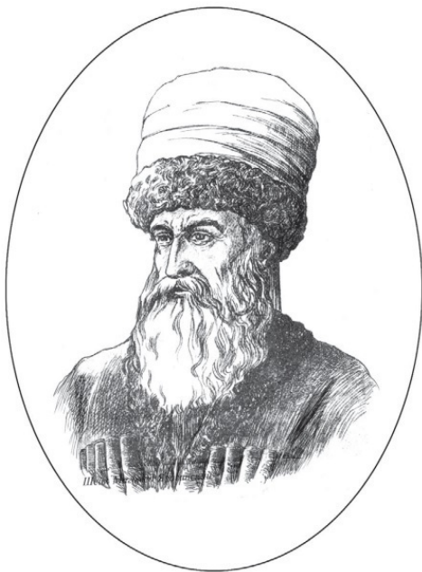
Шейх Магомед Ярагский

и в Азербайджане. Этот возмутитель спокойствия, будучи арестованным Аслан-беком Казикумухским, бежал в Табасаран, затем нашел убежище в Унцукуле. Как учитель тариката он имеет большое влияние на наше духовенство. В Унцукуле недавно состоялось собрание влиятельных людей вольных обществ. На этом собрании избран имам, который возглавит повстанцев.