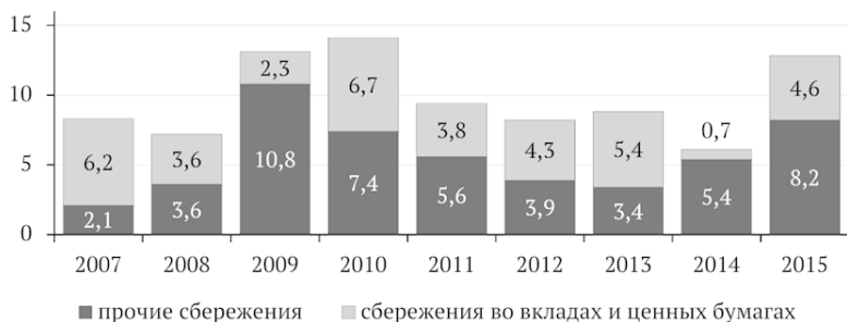
Рис. 2. Доля сбережений в общем объеме денежных доходов населения, январь-сентябрь 2007-2015 гг., %

варе-сентябре 2009 г. Поскольку сбережениями, как правило, обладают среднедоходные и высокодоходные группы населения, то рост «прочих сбережений» означает сокращение потребления данными группами дорогостоящих товаров и услуг и переход к сберегательной стратегии.