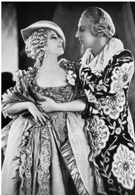
Иван Мозжухин в роли Казановы (1927). Партнерша – Рина Де Лигуоро

Пересуживалась какая-то странная история с операцией носа, которую будто бы потребовали от него голливудские продюсеры. Они-де считали, что благородный орлиный нос Мозжухина, почти столь же восхищавший публику Европы,