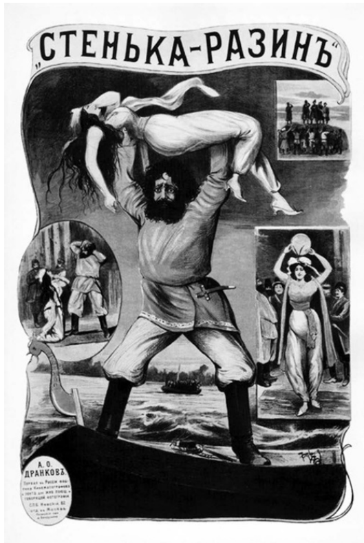
Плакат к фильму «Понизовая вольница (Стенька Разин)». 1908 г.