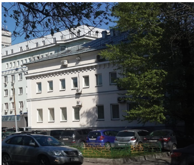
Дом в 2013 году (ул. Гиляровского, д. 16, строение 2)