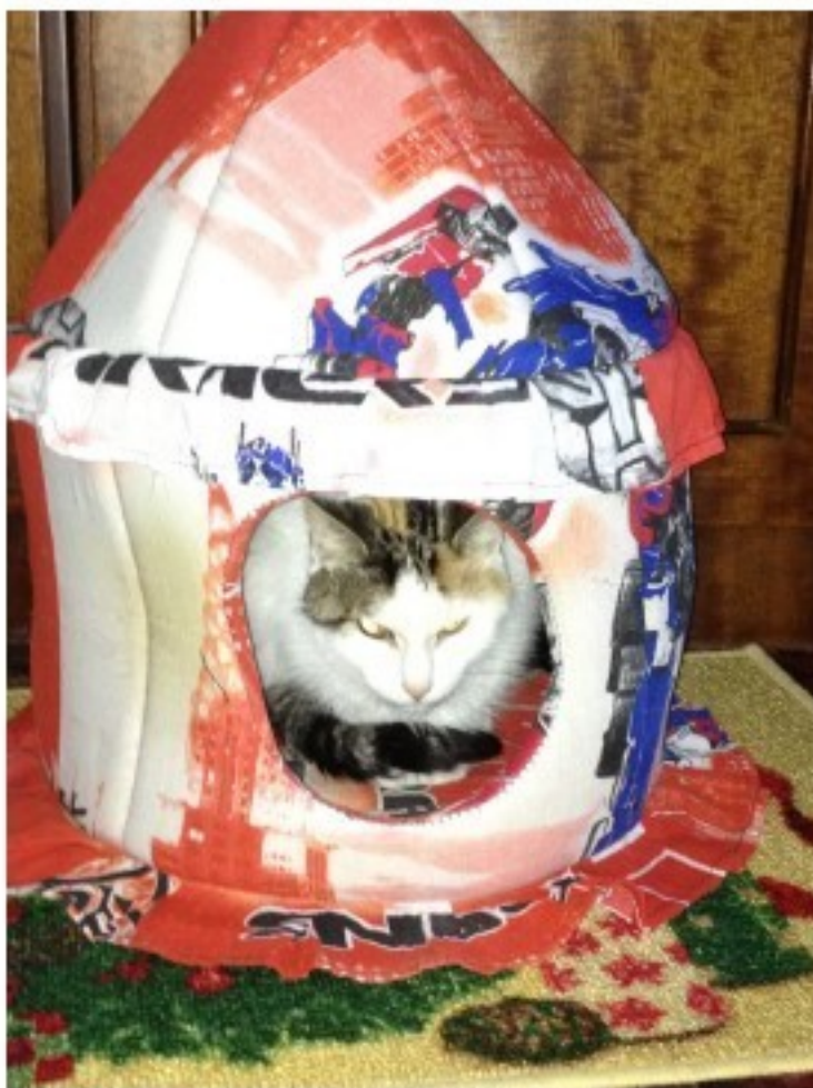
Сяся очень любила этот домик.