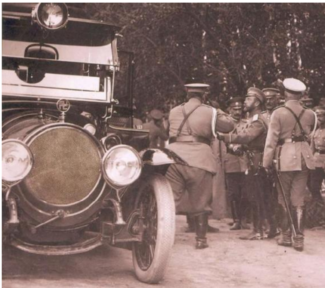
Свастика на открытке и дневнике Императрицы Александры

Свастика на личном автомобиле Николая II Delaunay-Belleville