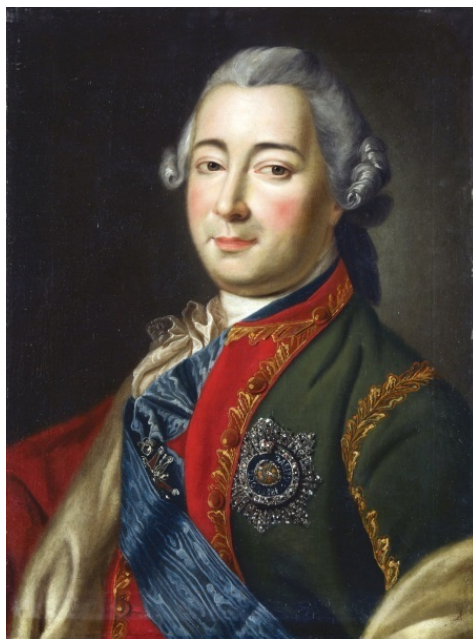
Императрица Елизавета Петровна и граф Разумовский, которые по версии «княжны» являлись ее родителями.