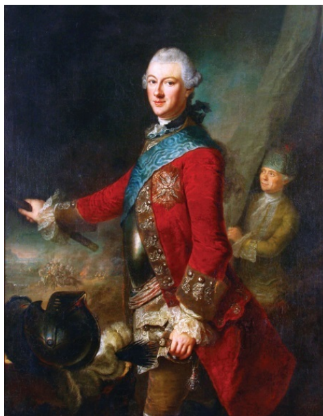
Михаил Казимир Огинский – государственный и военный деятель Речи Посполитой