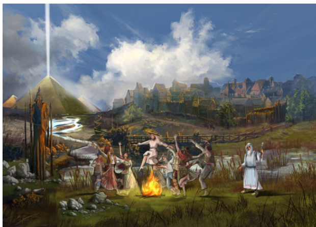
Рис. Гости южного поселения асаргов, приглашенные Цветимиром на славянский праздник

Время нещадно проверяет на прочность, горы и реки меняет степенно, все племена и народы меняет, и лишь сильнейших оно сохраняет. Вот и прошло уже оба столетия с битвы троянской, когда Троя погибла. Но снова на Трою город чем-то похожий гибнет в огне под ударами ночью. Люди уходят из города предков, все оставляют, спасаясь от мора. Все покидают в надежде на север, северный город, основанный позже.