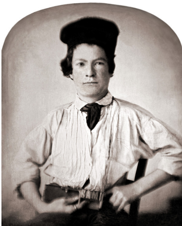
Это ещё не Марк Твен, но уже Сэм Клеменс, 1850