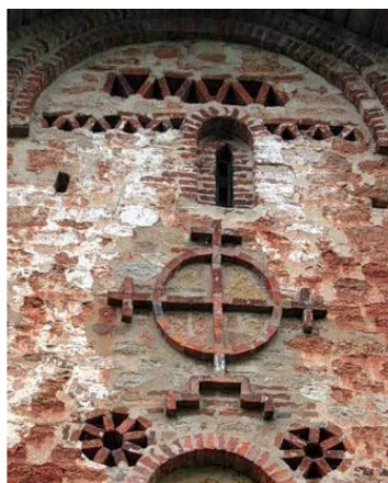
Замкнутый крест на фронте собора Петра и Павла в Новгороде

В раннехристианскую эпоху знак замкнутого креста переняли от иорданских скифов, например, копты. То есть христиане Египта. Это сейчас в Египте живут, в основном, арабы. Исконным же населением его были копты, родичи скифов. Коптская православная церковь и по сей день имеет замкнутый крест – чуть видоизмененный – главным своим христианским символом!