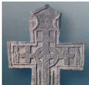
Дониконианский каменный поклонный крест с надписью «Царь славы».

ного изваяния представляет начертание замкнутого креста в точности . Особенно же примечательна на нем надпись: «Царь славы Ис Христос»!