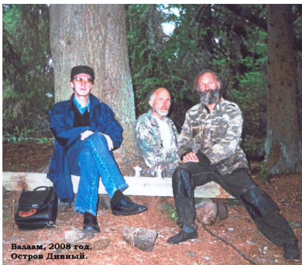
Валаам, 2008 год. Остров Дивный.