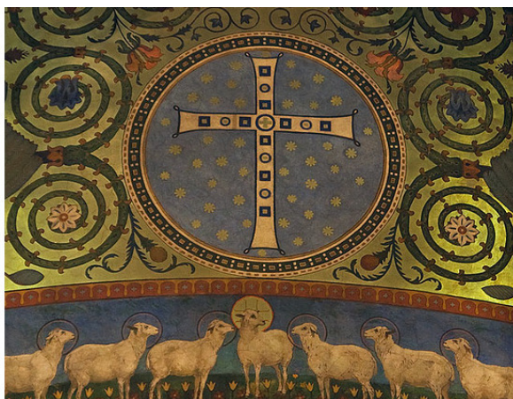
Фреска Виктора Васнецова, XIX в. Крест в круге. Агнец Христос.

Кстати, самый известный живописец на старорусские темы Виктор Васнецов именовал себя всегда не иначе, как СКИФОМ. И вот именно в ознаменование своего скифства – расписывал прекрасными фресками православные храмы России XIX века, подвижнически трудился на этом поприще!