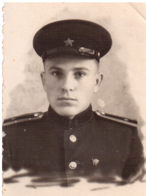
Октябрь 1954 года. Моя первая «военная» фотография

Приближалось 1 октября, и нужно было переодеться в совершенно новое обмундирование и обувь, разместиться в казарме, получить имущество, полагающееся курсанту для учёбы и жизни, ознакомиться с распорядком дня, расположением учебных корпусов и т. д. Столовую, конечно же, мы уже и так знали.