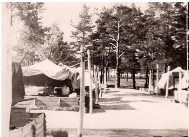
Наша ротная аллея

Рота наша численностью около 100 человек занимала половину первого этажа трёхэтажного двухподъездного здания. Во всём этом здании размещался 1-й и 2-й батальоны (всего 6 рот) училища. 3-й и 4-й батальоны примерно такой же численности размещались в другом здании, метрах в трёхстах от нашего. Внутреннее убранство казармы было спартанским – двухъярусные металлические койки на асфальтовом полу, прикроватные тумбочки (тоже в два яруса) и табуретки по числу квартирующих, взводные вешалки для верхней одежды (шинелей), взводные пирамиды с личным оружием, ленинская комната для проведения собраний, политинформаций и отдыха в личное время, умывальник только с холодной водой, кладовая (каптёрка) с личными вещами курсантов и всё. Никаких прикроватных ковриков и тапочек не полагалось. Туалет типа «сортир», один на всё здание, находился метрах в сорока среди деревьев. Централизованного отопления не было. Тепло должно было обеспечиваться двумя голландками, топившимися дровами и углём. Обязанность по топке печей возлагалась на дневальных суточного наряда. Тепла от этих печей практически не ощущалось, в казарме всегда была «здоровая» температура, поэтому иногда в очень холодные ночи старшина роты разрешал укрываться шинелями.